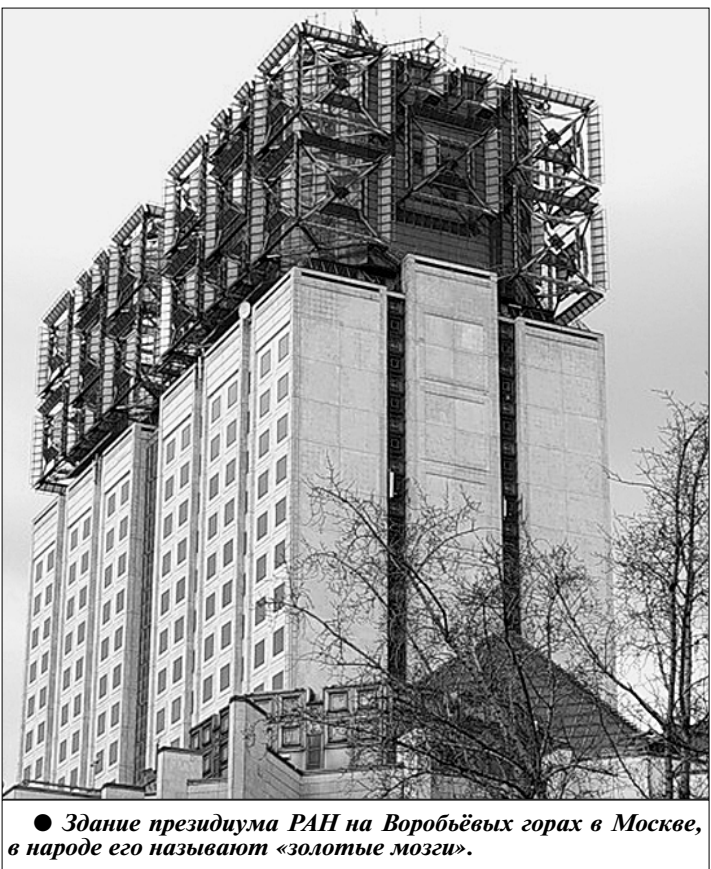
● Здание президиума РАН на Воробьевых горах в Москве, в народе его называют «золотые мозги».

предложений и рекомендаций, как и в целом научной политики, Минобрнауки РФ и ФАНО. Выяснилось, что никто не смог понять процедуру «экзамена», который эти чиновничьи структуры навязывают не только академическим институтам, но и всем научным организациям Российской Федерации. Оценка эффективности работы научных коллективов по 25—35 искусственным показателям