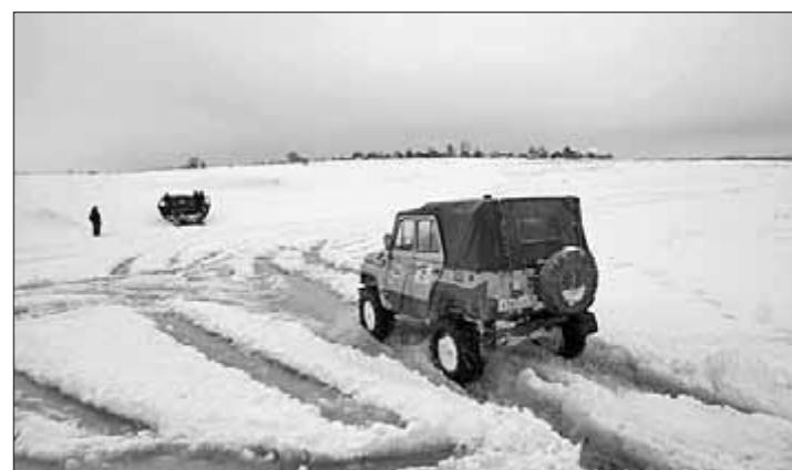
● Эх, дороги...