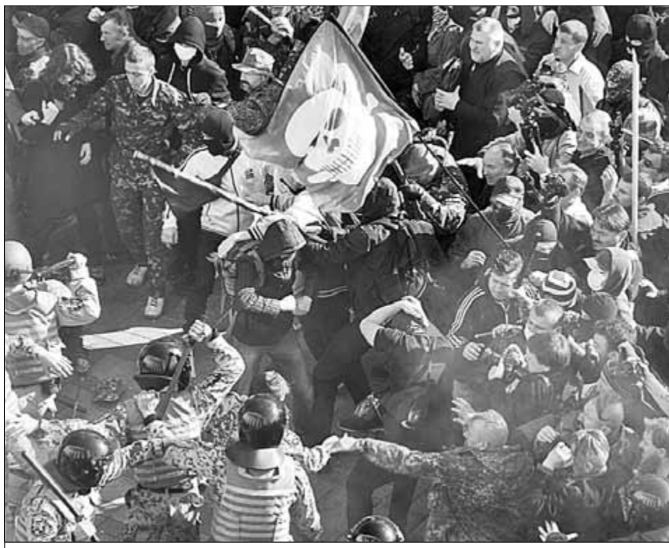
● У здания Верховной Рады.

А в Одессе филиалы организаций «Социал-национальная ассамблея» и «Патриот Украины», а также добровольческий полк МВД Украины «Азов» были вынуждены отменить запланированную факельную шествие «Марш героев «Иду на вы!» «Отмена марша связана с проведением масштабной акции в Киеве, куда съезжаются патриоты со всей Украины, и с ин-