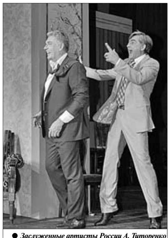
Заслуженные артисты России А. Титorenko и С. Галкин.