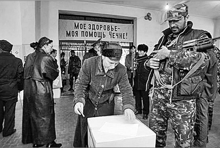
«Правильное» голосование обеспечено.