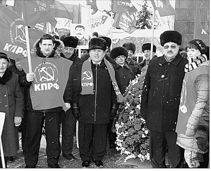
● 8 февраля, в день 67-й годовщины освобождения Курска от немецко-фашистских захватчиков, коммунисты принимали участие в возложении цветов к братским могилам советских воинов на Мемориале памяти павших.