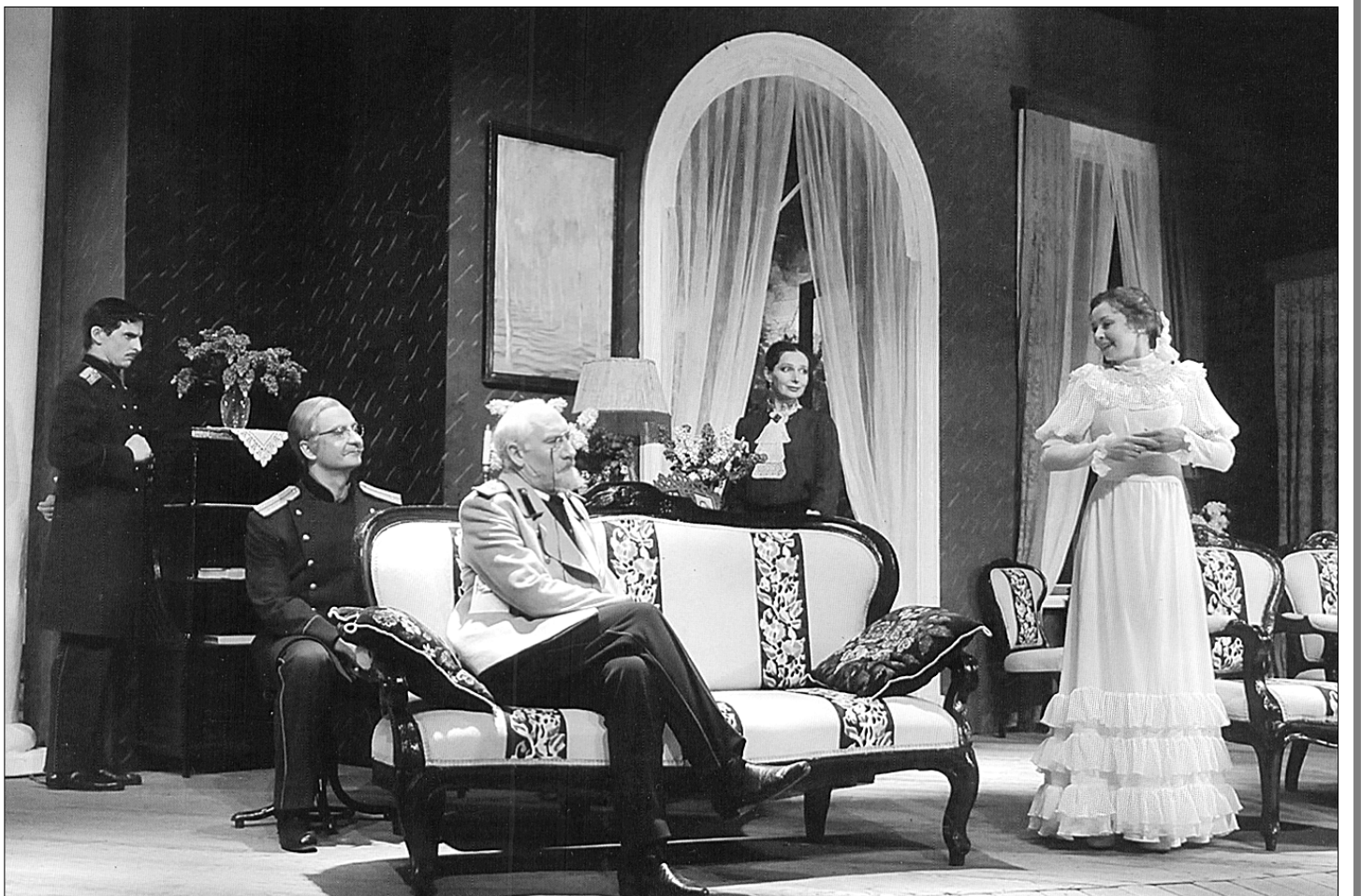
● Сцена из спектакля МХАТ имени М. Горького «Три сестры». Постановка В.И. Немировича-Данченко, режиссёр по возобновлению — Т.В. Доронина. Премьера состоялась 6 января 2010 года.