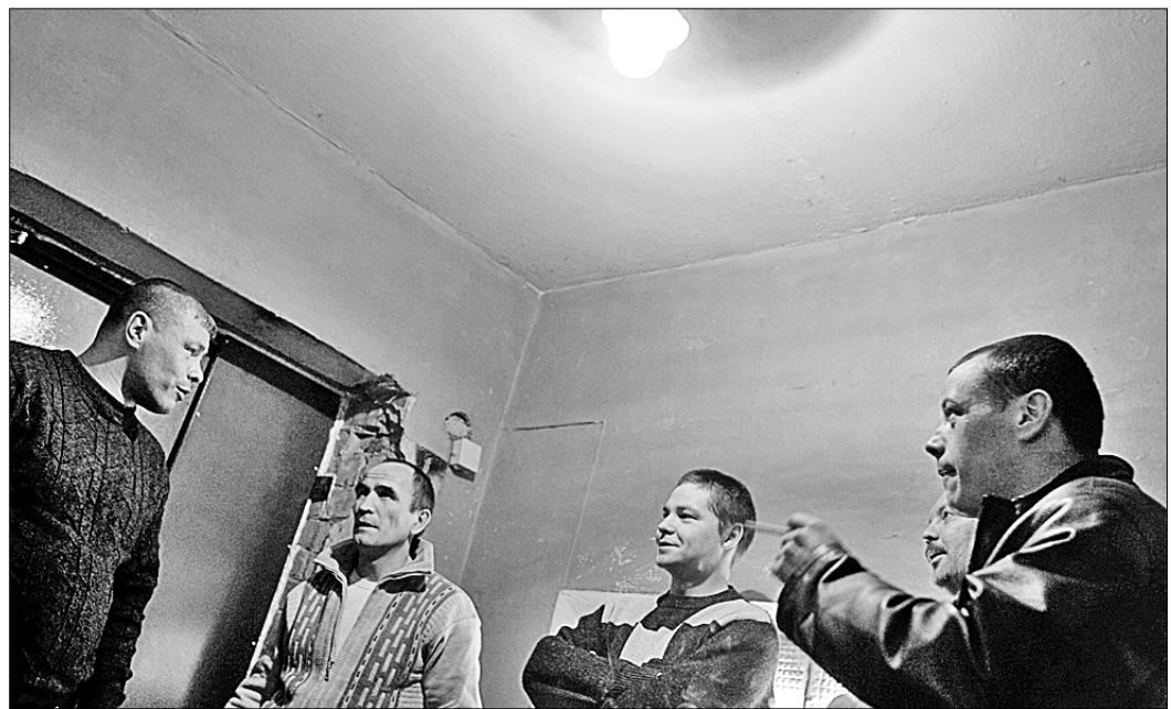
● Финансовый кризис поставил на грань выживания сталелитейную фабрику в уральском городе Златоуст, чьи работники неоднократно объявляли голодовку, требуя современной выплаты зарплат. Но безрезультатные акции вынудили сотрудников искать иные способы борьбы за свои права.