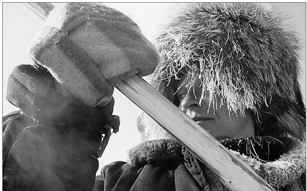
● Новоенисейский лесопильно-деревообрабатывающий комбинат, расположенный в 300 км от Красноярска, — одно из ведущих предприятий отрасли, чья продукция идет на экспорт. Однако завод, рабочие которого вынуждены трудиться под открытым небом даже при температуре минус 45 градусов, давно нуждается в модернизации.