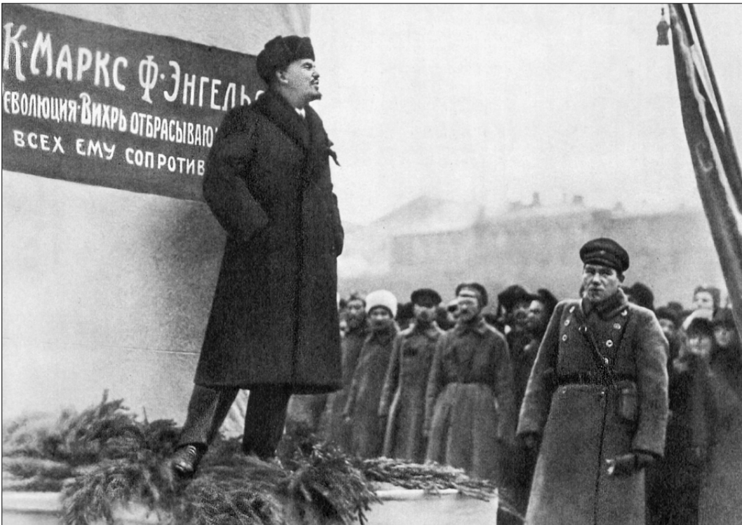
● В.И. Ленин произносит речь на открытии временного памятника К. Марксу и Ф. Энгельсу. Москва, 7 ноября 1918 года.

В День памяти В.И. Ленина и в преддверии 140-летия со дня его рождения воспроизвожу мою беседу с Александром Зиновьевым о масштабе ленинских дел и ленинской личности.