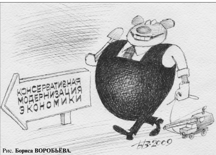
Рис. Бориса ВОРОБЬЕВА.

США, Японии и Китая по количеству потребляемых предметов роскоши, и ходят слухи, что нам не хватает всего чуть-чуть, чтобы