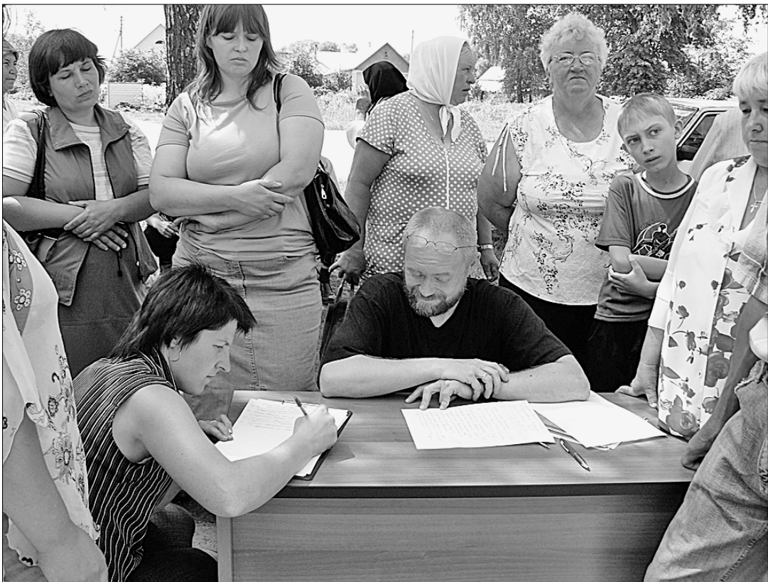
● Сход жителей села Большая Кузьминка Липецкого района, где безоговорочно было решено сохранить местную девятилетку.