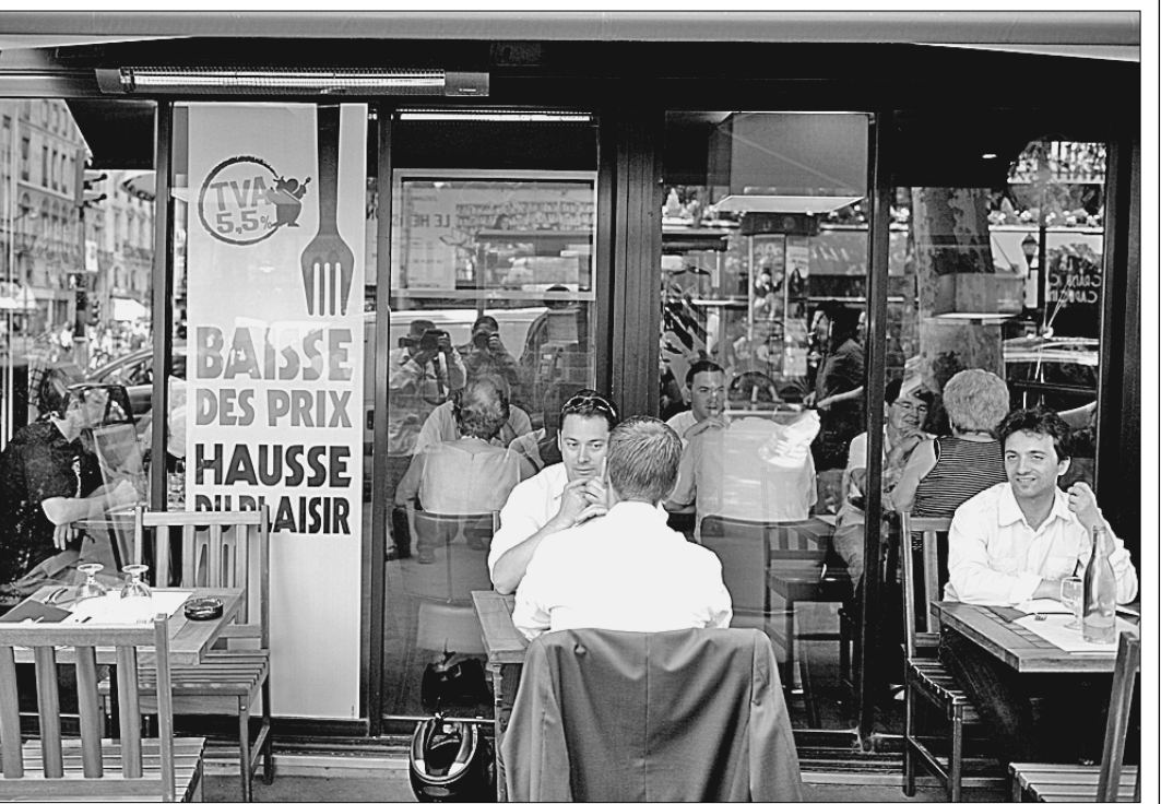
● Рестораны, кафе и закусочные во Франции переживают необычайный наплыв посетителей — с 1 июля практически все заведения общепита в стране снизили цену на еду примерно на 10%. На такую меру рестораторы согласились после того, как Никола Саркози заявил о сокращении НДС с 19,6% до 5,5%. По оценке экспертов, это приведет к расширению системы питания. В результате появится 40 тыс. новых рабочих мест, при этом 20 тыс. будут зарезервированы специально для молодежи.

(По сообщениям информационных агентств).