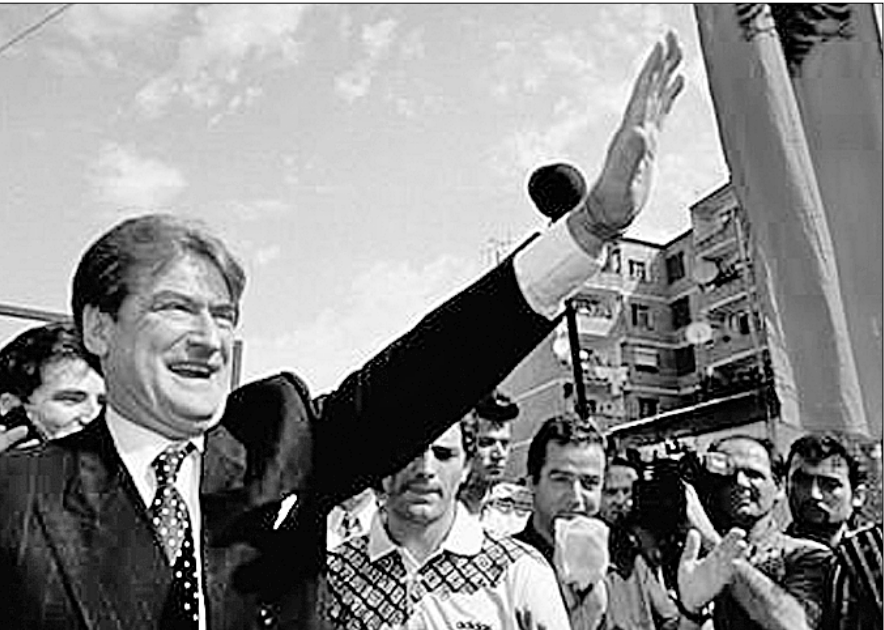
● Сали Беризи прекрасно знал, что на севере Албании существовали нелегальные лаборатории, где у похищенных косовских сербов вырезали внутренние органы на продажу.

На мощную поддержку Германии опирался и Сали Беризи в бытность президентом Албании в 90-е годы. По заявлению министра иностранных дел Клауса Кинкеля, к февралю 1998 года правительство Германии предоставило Албании помощь в размере около миллиарда марок — больше, чем какой-либо другой стране в расчете на душу населения. Однако американцы тоже положили глаз и на албанские порты, и на стратегически важное Косово. По меткому за-