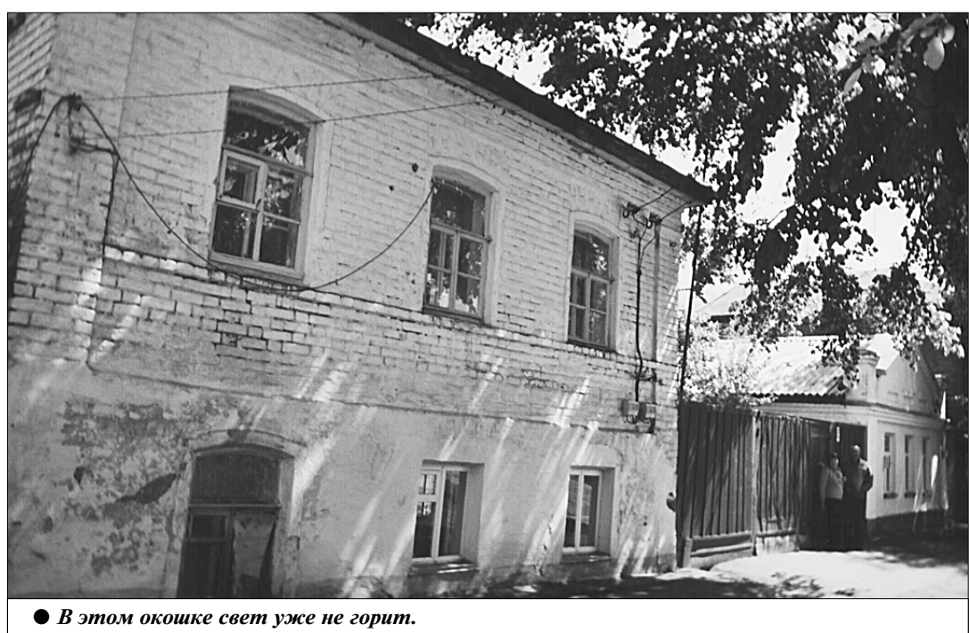
● В этом окошке свет уже не горит.

пальный голод. В черноземный Моршанский уезд со всех концов империи стекались голодающие, но прокормить всех эта земля не могла. Да и местные крестьяне бедствовали — за неимением у них отбирали лошадей, инвентарь. Шли в город — за милостыней. «Это было только самое начало «реформ», уже тогда впереди были большие опасения. Но кто бы мог предположить, что они отбросят страну на сто лет назад!