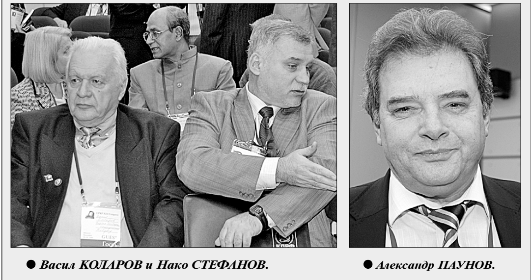
● Васил КОЛАРОВ и Нако СТЕФАНОВ. ● Александр ПАУНОВ.

5 июля в Болгарии состоятся парламентские выборы. О социально-экономической и политической ситуации в республике накануне этого события в беседе с обозревателем «Правды» Татьяной АВЕРЧЕНКО рассказывают первый секретарь Коммунистической партии Болгарии (КПБ) Александр ПАУНОВ и сопредседатели Партии болгарских коммунистов (ПБК) Нако СТЕФАНОВ и Васил КОЛАРОВ.