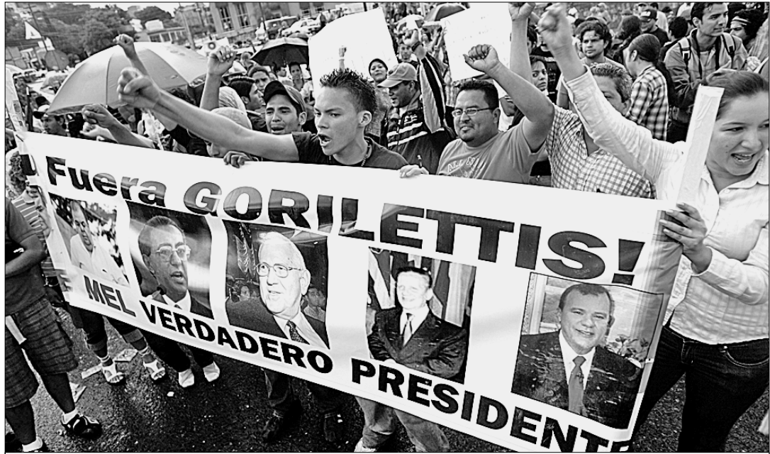
● Обращаясь к главарям хунты, гондурасцы скандировали: «Прочь, чёрные гориллы! Мануэль Селайя — настоящий президент!»

Но подобный вариант не устраивал противников перемен в лице коррумпированной политической и военной верхушки, местных олигархов, транснациональных компаний. Против демократически избранного президента было применено вооружённое насилие. И это вызвало