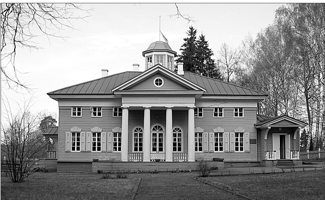
На холме домик мой; с балкона Могу сойти в веселый сад, Где вместе Флора и Помона Цветы с плодами мне дарят...

Там, в Царском Селе, ему грезится Захарово («Мечты находят, во плен отдался я мечтам»), и волшебник слова Пушкин в одном из произведений создает вечный монументальный поэтический памятник селцу: