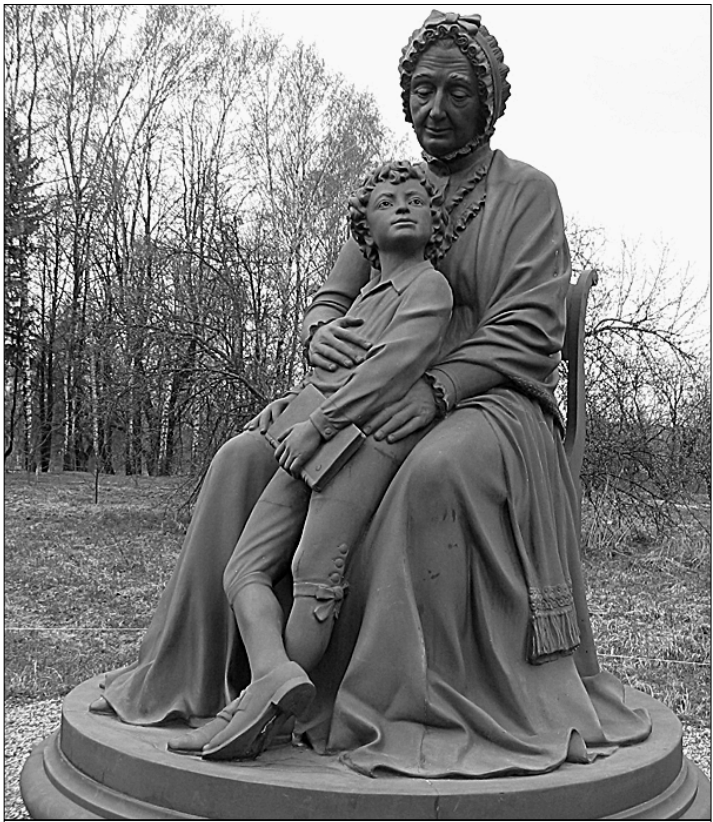
● Эта скульптурная композиция запечатлела юного Пушкина и его бабушку.

Соити с балкона домика на холме в веселый сад Пушкин на сей раз не решился, опасаясь увидеть еще более страшные разрушения, а не «милые картины».