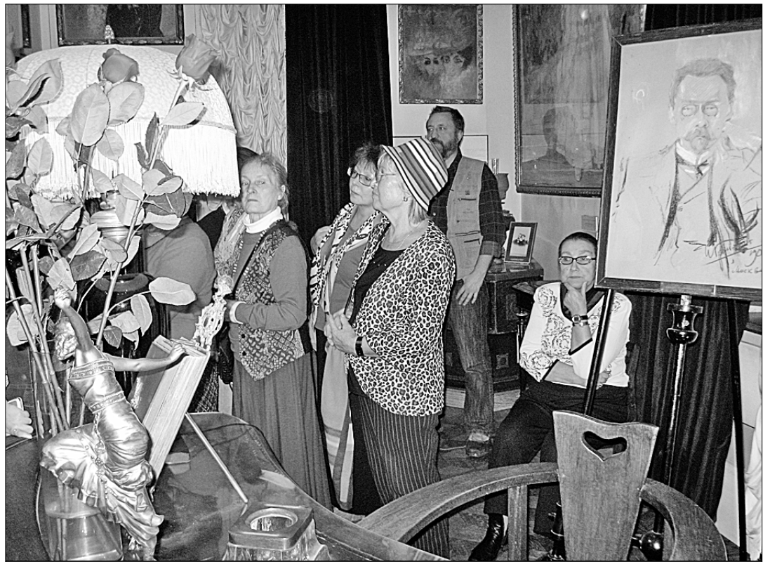
● В ГЦТМ имени А.А. Бахрушина.