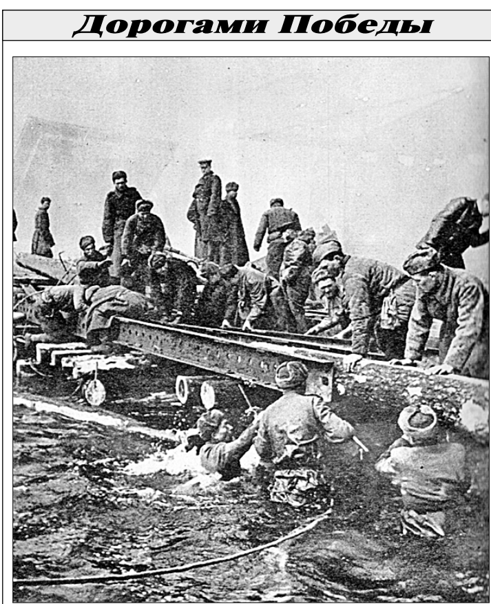
● Саперы строят переправу через Одер. 1945 год.