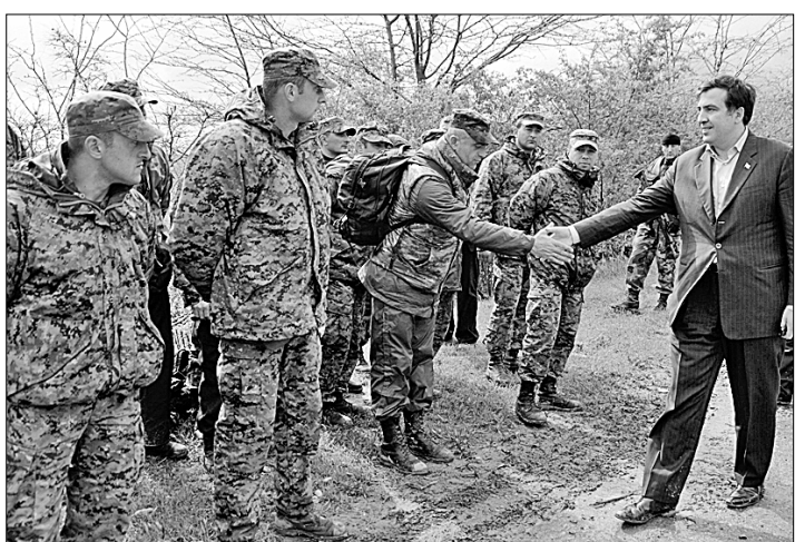
Автор опасной провокации благодарит ее старательных исполнителей на базе Мухровани.

Вазани — крошечная точка на карте Грузии вблизи Тбилиси сегодня стала объектом пристального внимания мировых СМИ. Коллеги-журналисты рассуждают: начнётся или не начнётся отсюда большая война? Думаю, «проблема Вазани» создаёт дополнительную существенную нагрузку на «стальной хребет» госпоина Обамы — именно в Грузии зреет серьёзный глобальный кризис, который отразится (скажем мягко) и на Соединённых Штатах.