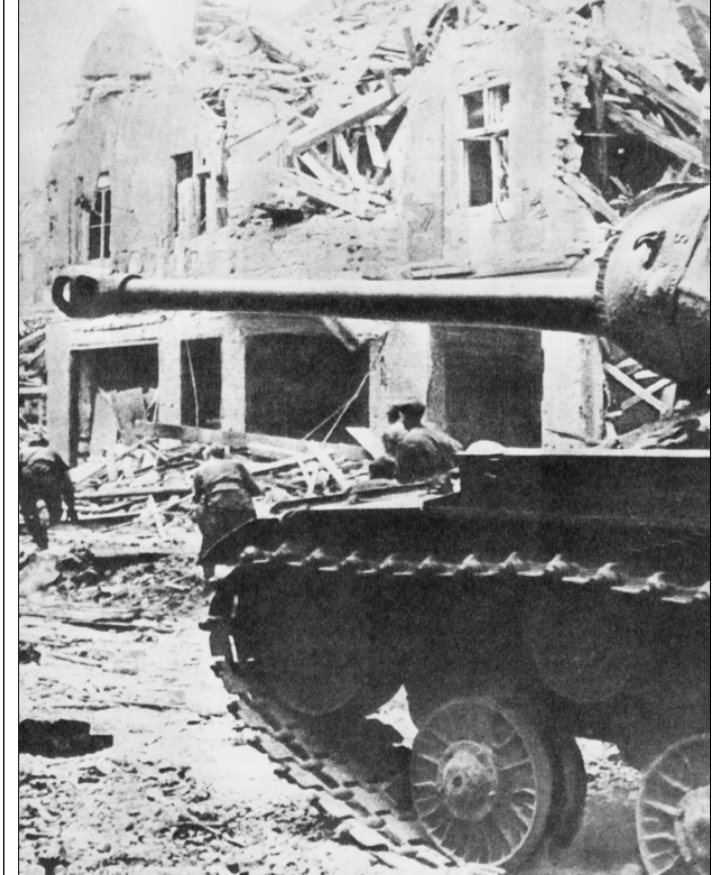
● Танкисты поддерживают пехоту, штурмующую опорные пункты врага. Берлин. Апрель 1945 года.

НЕ БЕЗ ТРУДА хоккеисты сборной России преодолели четвертьфинальный барьер чемпионата мира, с разницей в одну шайбу обыграв белорусскую команду — 4:3. Героем кончиков матча стал наш лидер Илья Ковальчук. Сначала он, совершив слаженный проход слева ли не через всю площадку, провёл четвертый гол. А за несколько секунд до окончания третьего периода, когда соперники сменили вратаря шестым полемым игроком, оккупировали зону защиты россиян и нанесли неотразимый, казалось, «шелчок», именно этот забивной форвард подставил свою грудь под летящий с огромной скоростью каучуковый диск, лишив противника возможности спасти поединком.