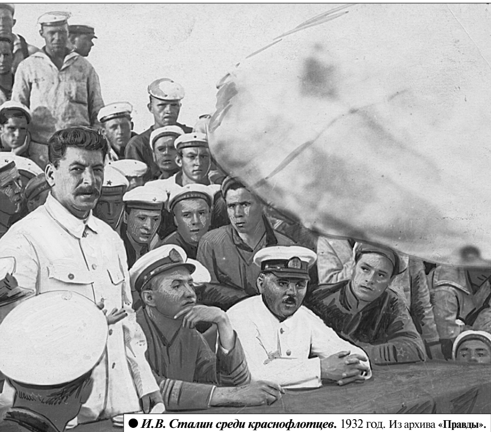
● И.В. Сталин среди краснофлотцев. 1932 год.

летия. Это будет приговором царскому правительству во время Первой мировой войны. Как отмечал монархист Василий Шульгин, война стала приговором «всем нам, всему правшему и неправшему классу, всей интеллигенции, которая жила бесцельно, не обращая внимания на то, как беднеет в