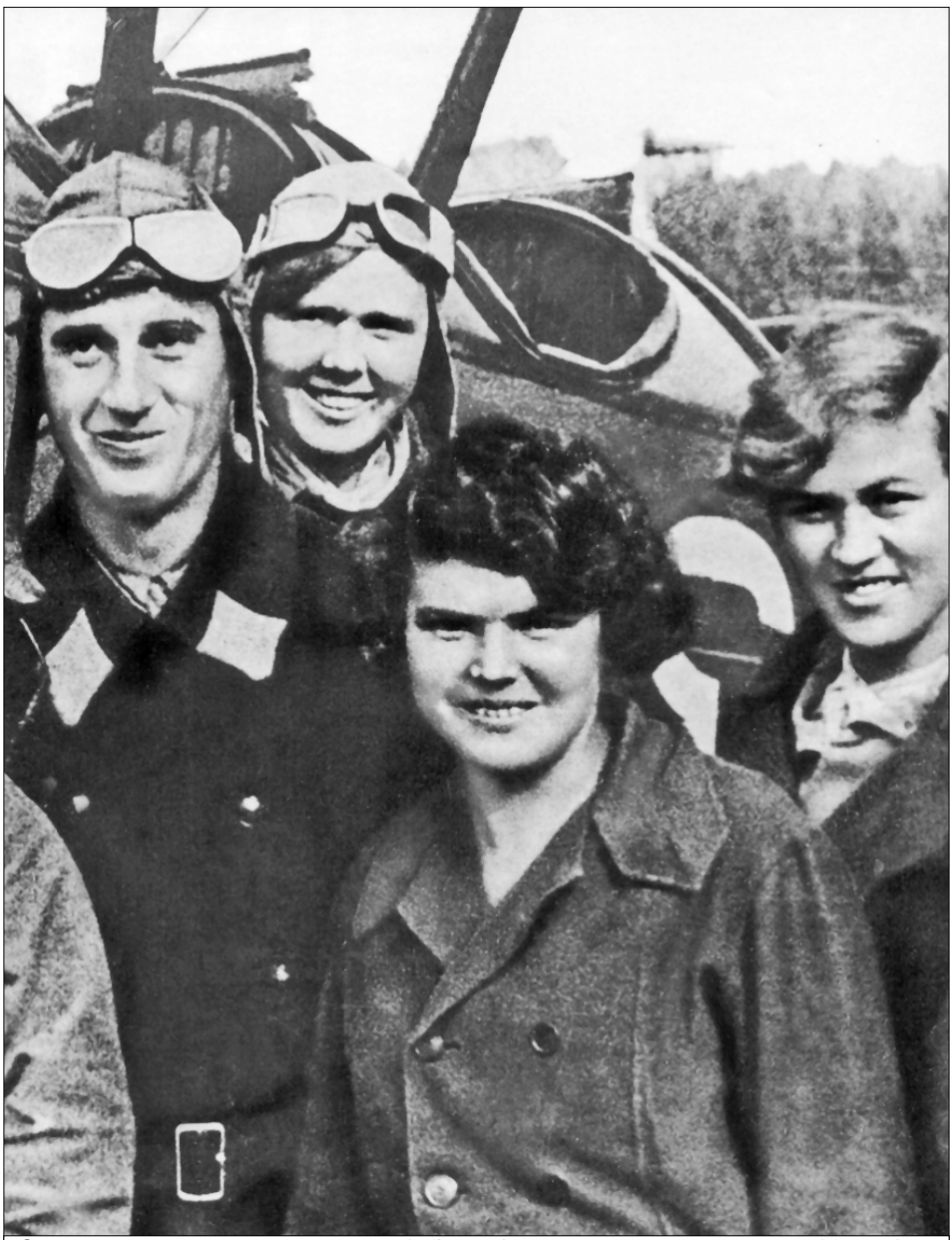
● «Комсомольцы — на самолёты!» Это один из популярных лозунгов 30-х годов.

Апофеозом западной политики «умиротворения агрессора» стало Мюнхенское соглашение 1938 года о передаче Судетской области Чехословакии немцам. Договор подписали Германия, Италия, Англия и Франция. Саму Чехословакию никто ни о чем не спросил. Постыдную роль сыграло польское правительство, которое обещало Германии военную помощь, если чехословаки будут сопротивляться. В марте Чехословакия вообще пе-