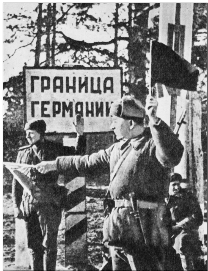
Советские регулировщики на улицах немецких городов.