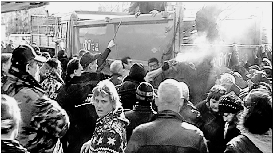
● Избиения, угрозы, газовые атаки — вот язык, на котором говорит с народом нынешняя власть (3 апреля на площади Металлургов). Фото с видеозаписи.