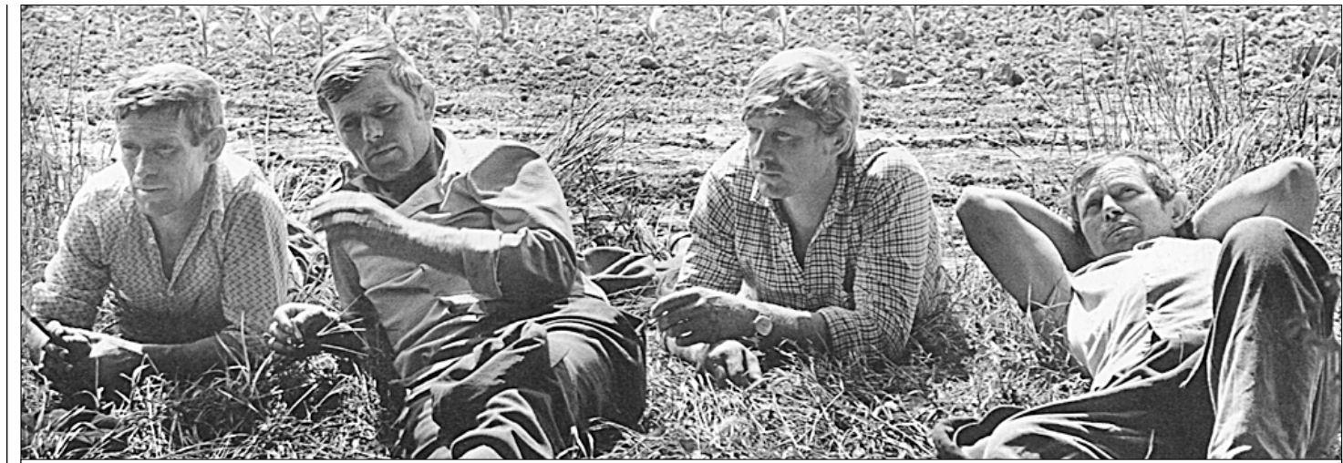
● После работы на поле весной.