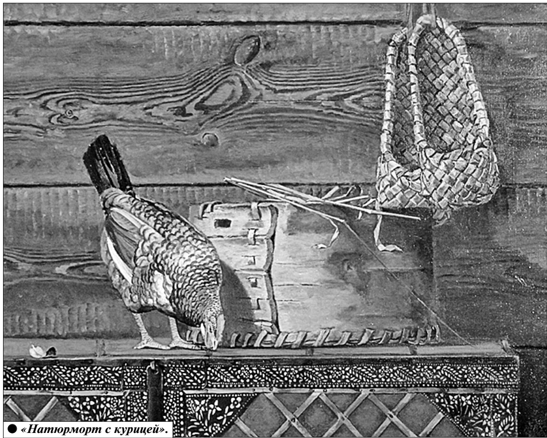
● «Натюрморт с курицей».