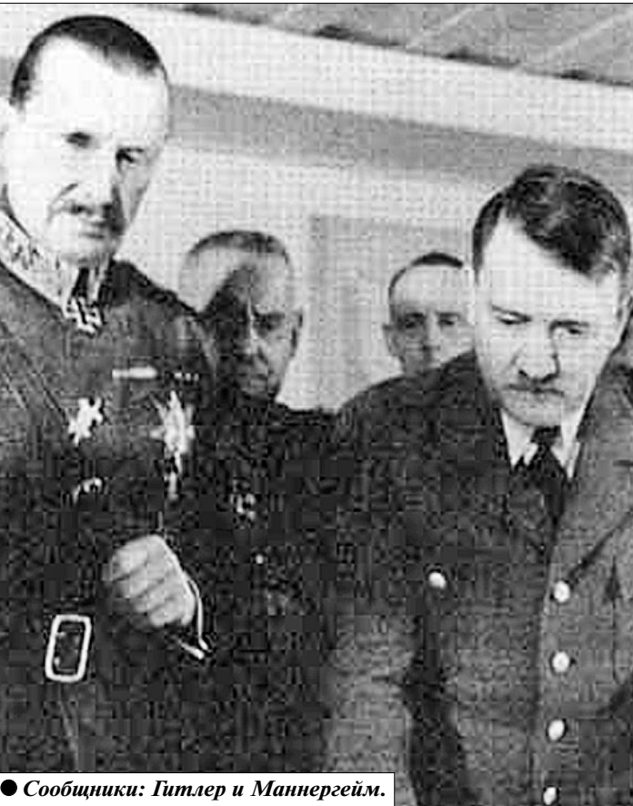
● Сообщники: Гитлер и Маннергейм.

ВАЛЛИНЕ издеваются над памятником советскому воину-освободителю, на Украине славят гитлеровского прихвостня Бандеру, в Нижегородчине создают музей изменника Власова — на всё это они взирают не просто сквозь пальцы, но как бы даже с плохо скрываемой симпатией, так же,