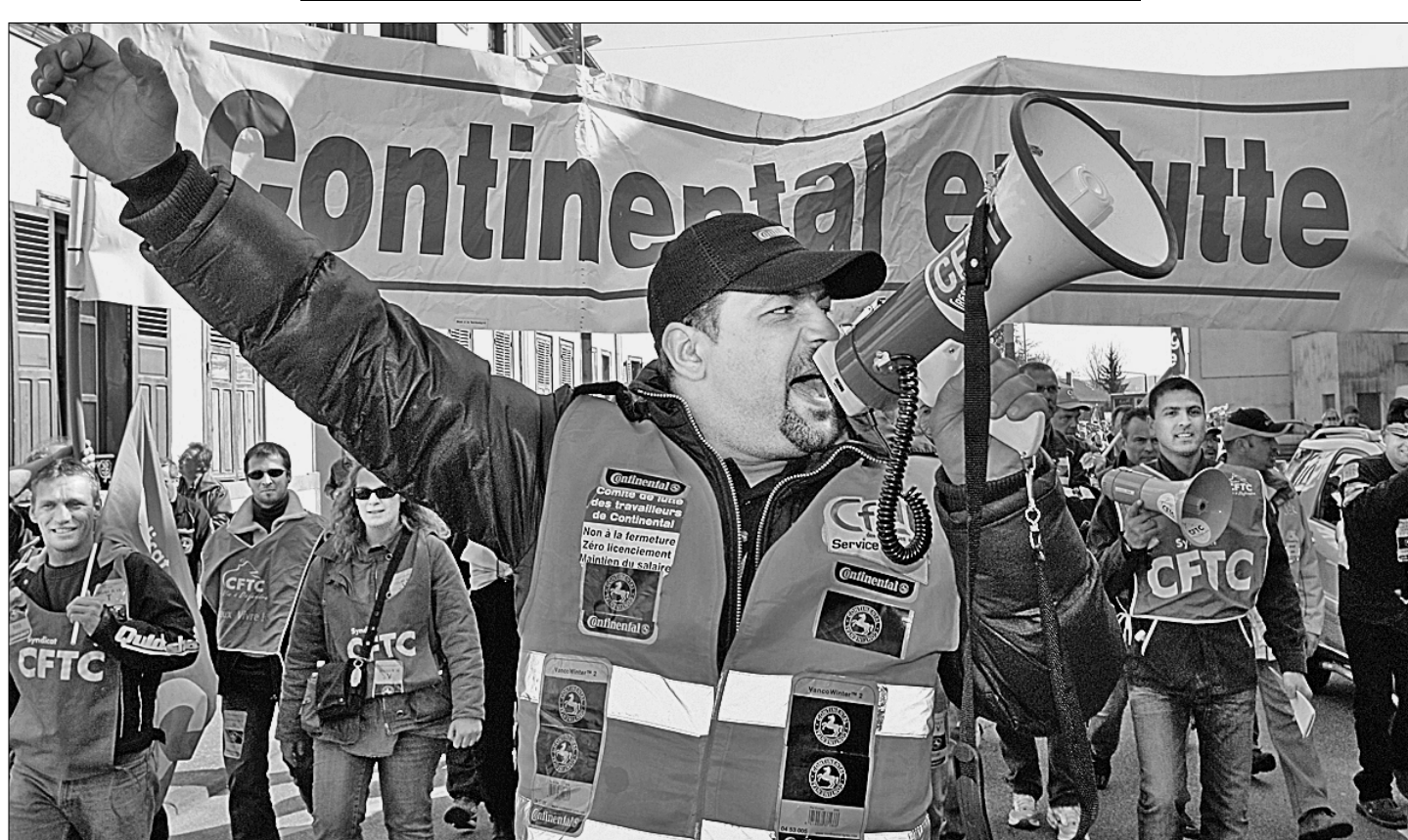
● Работники автомобильной промышленности Франции выступают против массовых сокращений в отрасли.