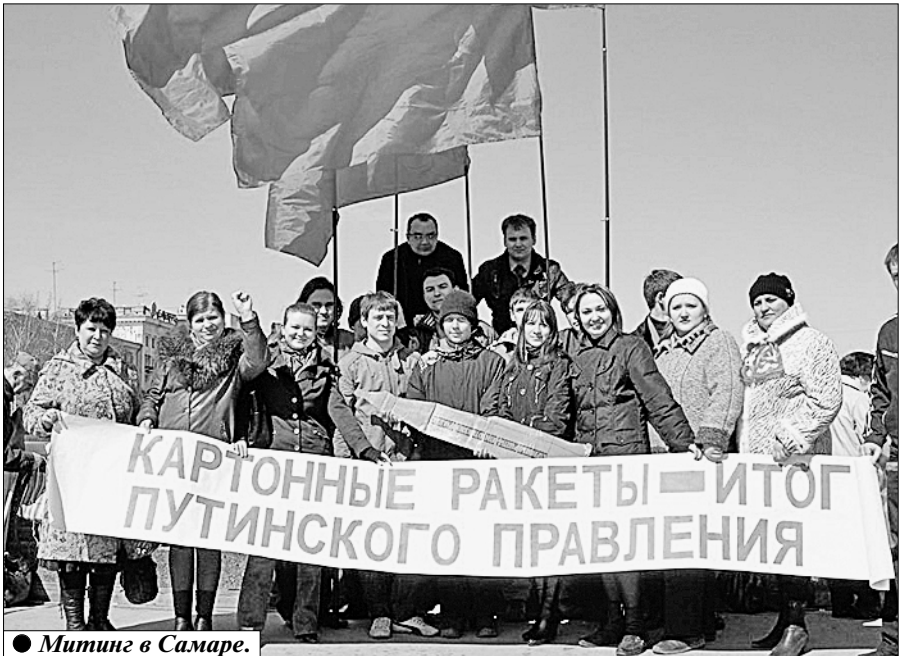
Митинг в Самаре.