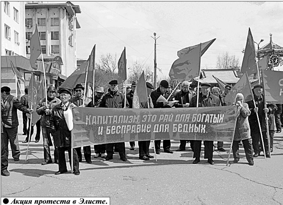
Акция протеста в Элисте.