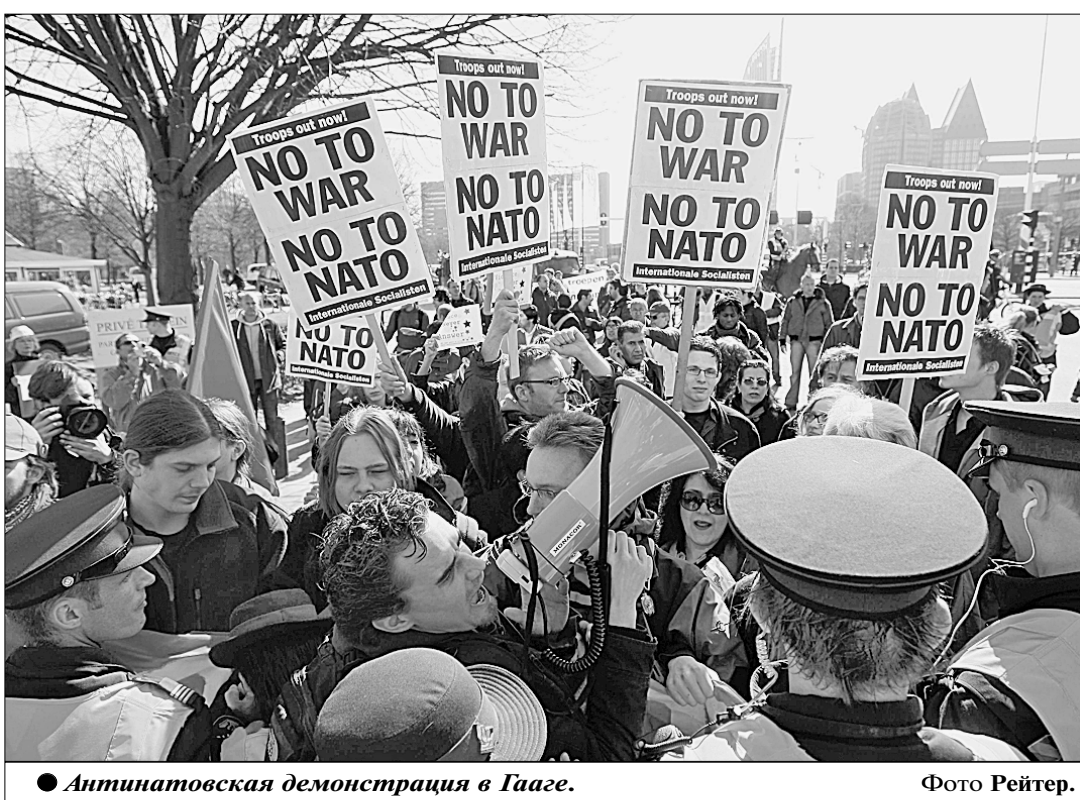
● Антинатовская демонстрация в Грузии.