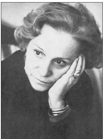
МЫ ПРОСТИЛИСЬ с Ольгой Васильевной Лепешинской. Она была гордостью советского хореографического театра, одной из подвизниц, посвятивших свою

жизнь изысканнейшему и труднейшему из искусств, притом никогда не порывавшей с живой многообразной жизнью, искавшей в ней поддержку своим творческим устремлениям.