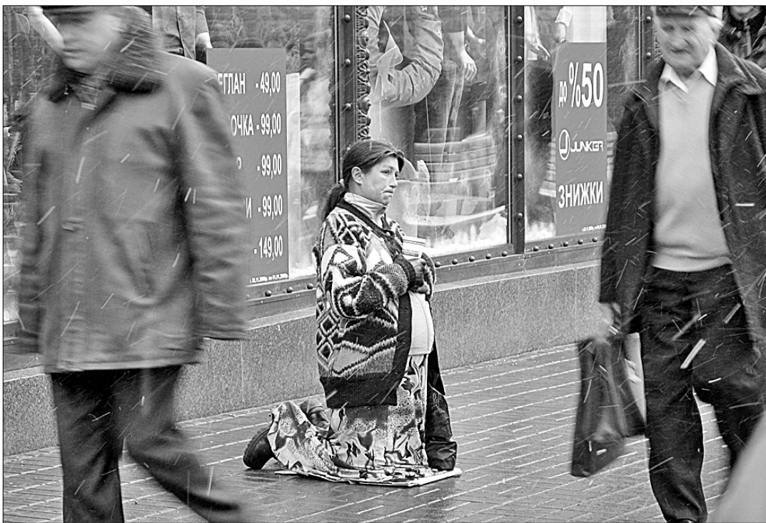
● Во многих городах Украины, которая, как и другие бывшие советские республики, стоит на грани дефолта, сильно возросло число людей, просящих подаяние. На улицах Киева к помощи взывают даже беременные женщины.

После избрания спикера Компартия требует немедленно начать принятие антикризисных программ. «Прекратите, освобождайте рабочих и останавливайте приватизированные вами предприятия, перестаньте спекулировать на финансовом рынке, отдайте людям деньги, которые они вам