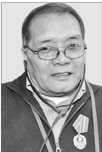
не только для России. Они, уверен, принесут новое дыхание в борьбу всех коммунистов во всех странах.

— Для нас весьма полезен опыт и КПСС, и КПРФ. Мы постоянно его изучаем. И решения XIII съезда вашей партии важны