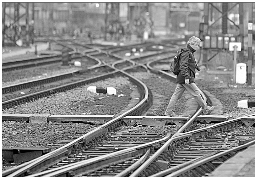
● Крупнейшая забастовка венгерских железнодорожников, начавшаяся 14 декабря, фактически парализовала движение поездов по всей стране. Организатор стачки — независимый союз работников железных дорог — требует повышения зарплаты для большинства сотрудников компании, а также выплаты единовременной премии после продажи компании MAV, являющейся оператором местных железных дорог, подразделения MAV Cargo.