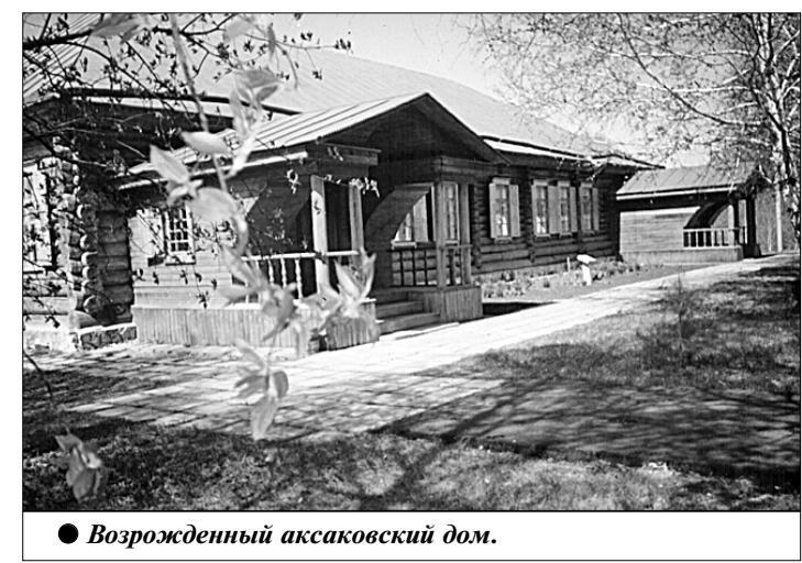
Возрожденный аксаковский дом.

«Версты за четыре до Аксакова, на самой меже нашего владения, я проснулся, точно кто-нибудь разбудил меня: когда проехали мы между Тимовым и Обшим колком и выехали на склон горы, должно было немедленно открыться наше Аксаково с огромным прудом, мельницей, длинным порядком изб, домом и березовыми рощами. Я беспрестанно спрашивал кучера: «Не видно ли деревни?» И когда он сказал, наконец, наклонясь к переднему окошку: «Вот наше Аксаково, как на ладони», — я стал так убедительно просить мою мать, что она не могла отказать мне и позволила сесть с кучером на козлах. Не берусь передать, что чувствовал мое сердце, когда я увидел: милое мое Аксаково! Нет слов на языке человеческого для выражения таких чувств!.. Быстро скатилась карета под изволок, переехала через плохой мост на Бугуруслане, завязла было в топи у Крути, но, выхваченная сильными конями, пронеслась мимо камышей, пруда, деревни — и вот наш сельский дом, и на крыльце его отец с милой моей сестрицей. Когда мы подъехали, она всплеснула ручонками и закричала: «Братец Сереженька на козлах!..» Выбежала тетка и вывела брата, кормилица вынесла маленькую мою сестру! Сколько объятий, поцелуев, радости, вопросов и ответов! Сбежалась вся дворня, даже крестьяне, случившиеся дома, и кучка мальчишек и девочек...»