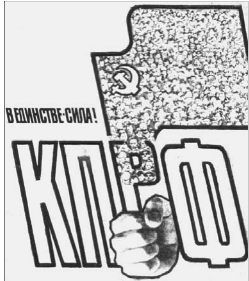
Плакат Геннадия КОМОЛЬЦЕВА.