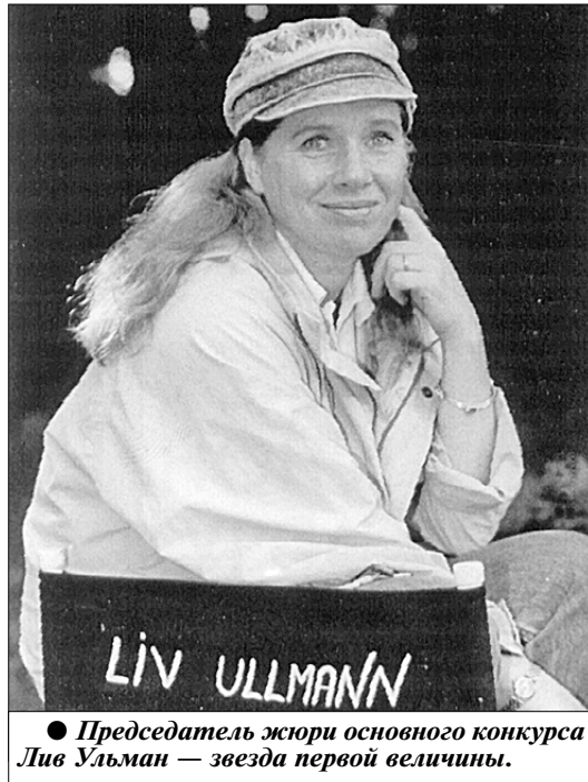
● Председатель жюри основного конкурса Лив Ульман — звезда первой величины.

Ретро? Но никаких примет конкретного времени в фильме нет. А что есть? Удушливая атмосфера гнетущего страха перед вселивыми и всепроникающими «органами», безжалостно выпалывающими на экране малейшие ростки инакомыслия и вообще всего живого. Но, вопреки, разве не в это примерно время чуть ли не в каждом магнитофоне рождался некий не затованный хрипловатый бас Высоцкого и не тогда ли выдхал под гитару столь же безнадзорный Окуджава? Издавались Пастернак с его «Живого» и Цветаева с «Белым станом». Вовсю швели и пахли «возмутительные» «Татанка» и «Ленком», а едва не схвативший за «Денисовскую» Ленинскую премию и вконец обморозивший Солженицын вежливо под белы ручки был препровожден в гостеприимные для иезинокво-антисоветских США. Как и другой «борец за свободу» — Буковский, уютно обосновавшийся в Англии. Мы жили в это время и всё это помним. А то, что вы нам впариваете, Роман Гурегович, на уличном сленге, знаете, как называется? Правильно: туфта. Нелостно как-то для почти классика, каковым вас представили на посвящённой фильму пресс-конференции. И ещё: в советское время вы считались вроде как фронтёром, пусть и умеренным («Полеты во сне и наяву», «Храни меня, мой талисман»), хотя в каталогах вас за это никто, кажется, не таскал. Что ж вы сейчас-то присоединяетесь к своре целующих власть в плечико конъюнктурщиков, всех этих млечных и сванидзе? Так недолго и вылететь из классиков-то. Причём с позором.