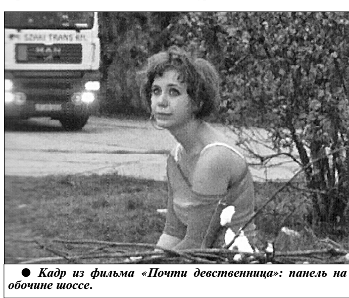
● Кадр из фильма «Почти девственность»: панель на обочине шоссе.

Как и ожидалось, побрызгал антисоветской слюной украинский фильм «Райские птицы», поставленный Романом Балааном. СССР, 1981 год.