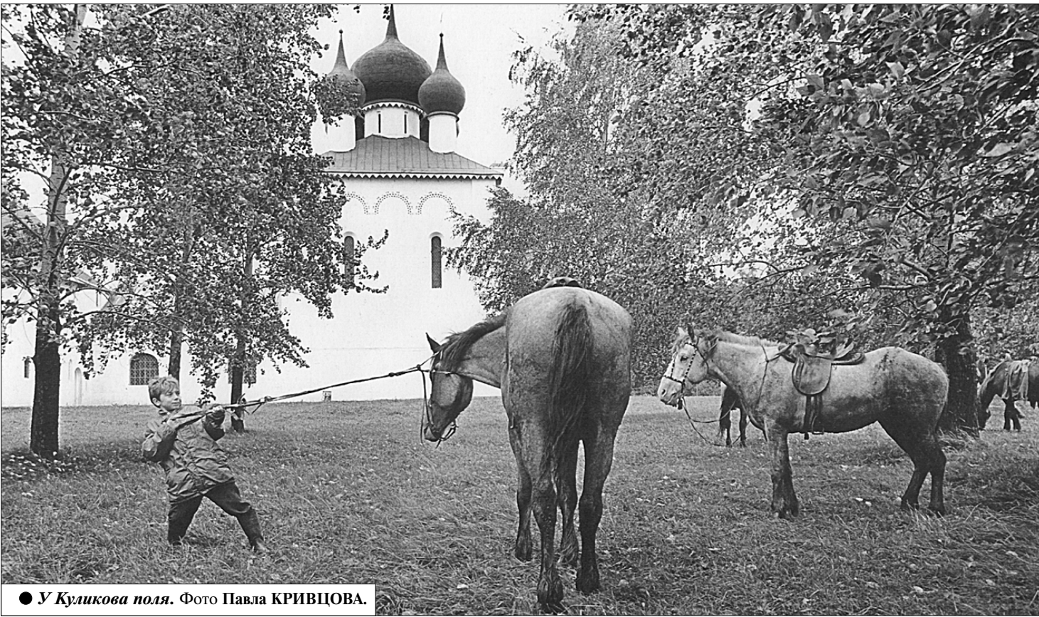
● У Куликова поля.