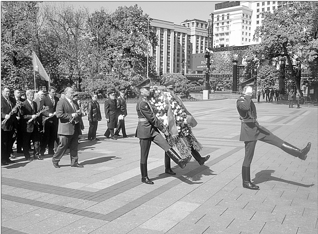
● 8 мая делегация ЦК и МК КПРФ и депутатов-коммунистов Государственной и Московской городской дум возложила цветы и венки к могиле Неизвестного солдата у Кремлевской стены.