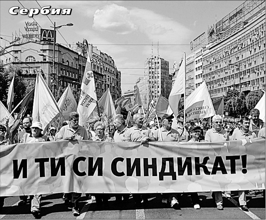
● День международной солидарности трудящихся жители Белграда отметили демонстрацией протеста против снижения уровня жизни.