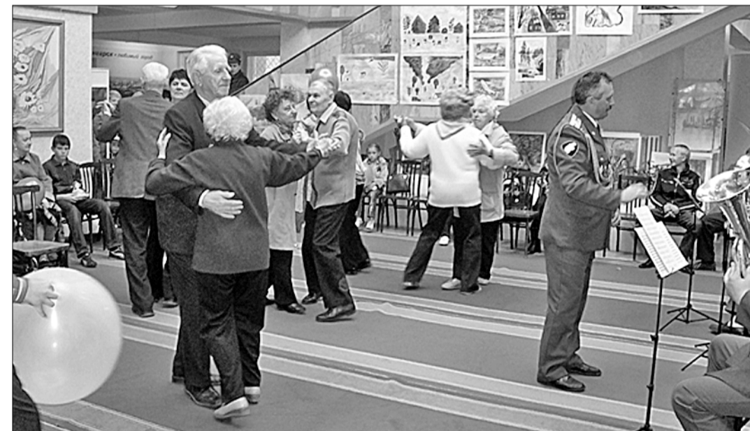
Ветераны войны и труда любят проводить здесь свои праздники.

Виктор КОЖЕМЯКО. (Спец. корр. «Правды») г. Ангарск, Иркутская область.