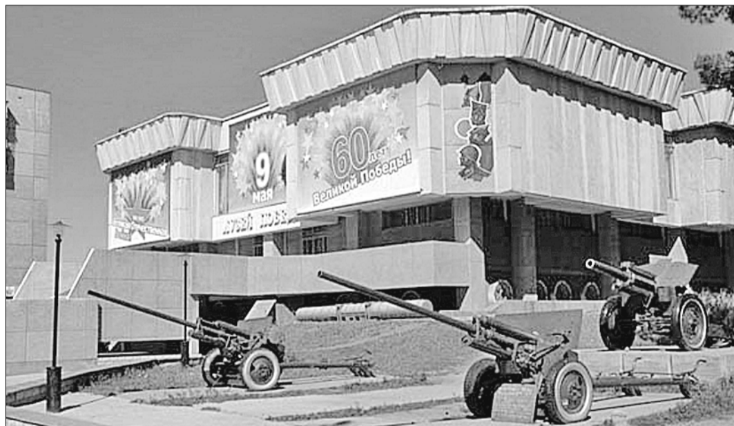
Так выглядит здание этого замечательного музея в Ангарске.