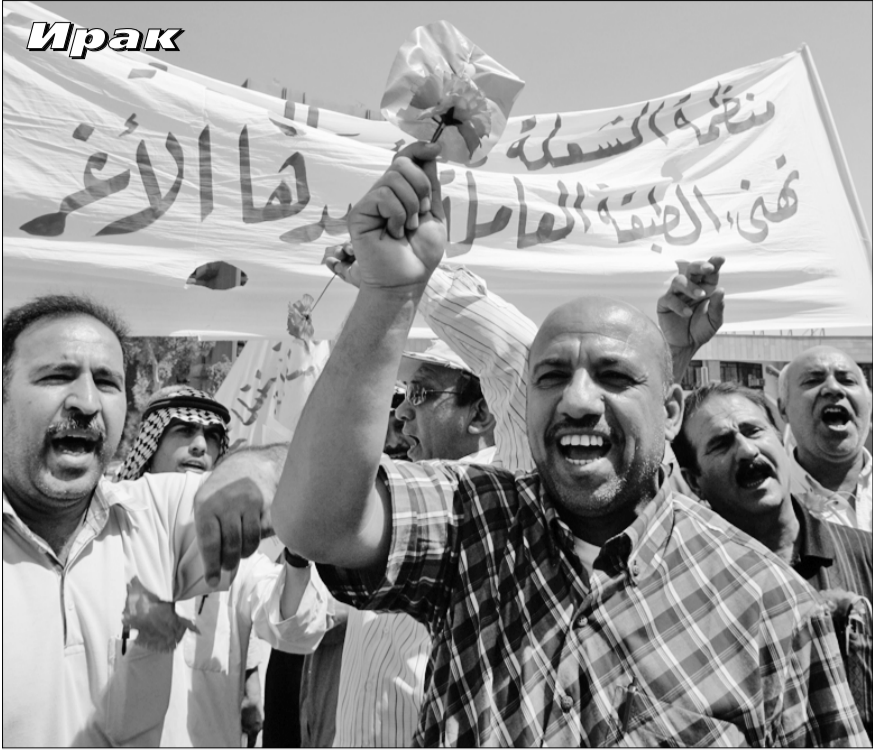
● Несмотря на американскую оккупацию страны, рабочие Багдада вышли на первомайскую демонстрацию.