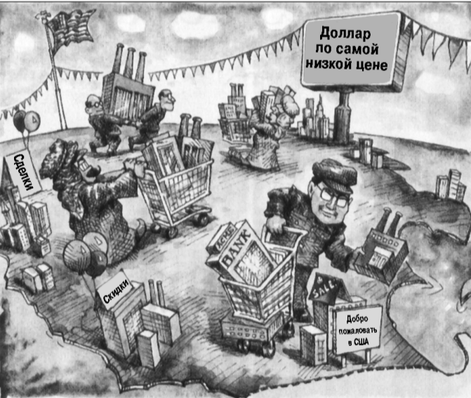
● Журнал «Ньюсуик» обеспокоен распродажей американской экономики иностранцам.

Муна предупредили во время его визита в Москву: если он будет поддерживать косовских сепаратистов, Россия заблокирует избрание Пака на второй легислатурный период.