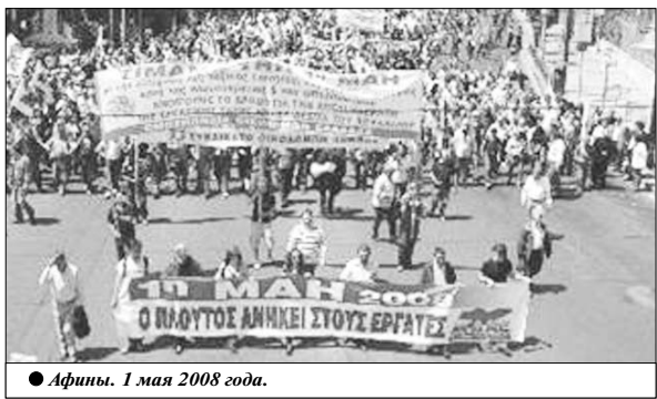
● Афины. 1 мая 2008 года.