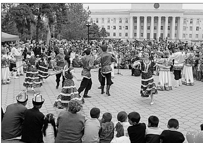
● Бишкек. 1 мая 2008 года.

Накануне праздника к соотечественникам с поздравлением обратился президент Белоруссии А.Г. Лукашенко. В нем отмечено: «Мирный труд — непреходящая ценность, гарантирующая стабильность и согласие в обществе. Для белорусского народа, пережившего немалые испытания, это особое достижение. В нашей стране люди умеют и любят работать. Развивается и укрепляется экономика, повышается уровень жизни граждан, создаются благоприятные условия для процветания каждого региона Белоруссии. Первой май и остается символом обновления, светлых надежд, взаимной поддержки и сплоченности, глубочайшего уважения к социальному труду. В этот день мы по многолетней традиции славим ветеранов, трудовой подвиг которых заложил основы нашей сегодняшней жизни, чествоем всех, кто строит прекрасное будущее». Первмайские народные гуляния прошли в Минске, Витебске, Гомеле, Гродно, Могиле, других городах, посёлках и сёлах республики.