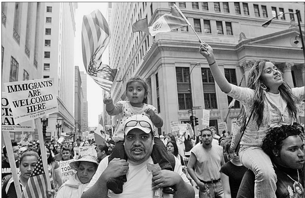
● Так выглядели в недавний первмайский день улицы американского города Чикаго, где в 1886 году рабочие организовали забастовку с требованием 8-часового рабочего дня, а также демонстрацию, закончившуюся кровопролитным столкновением с полицией.