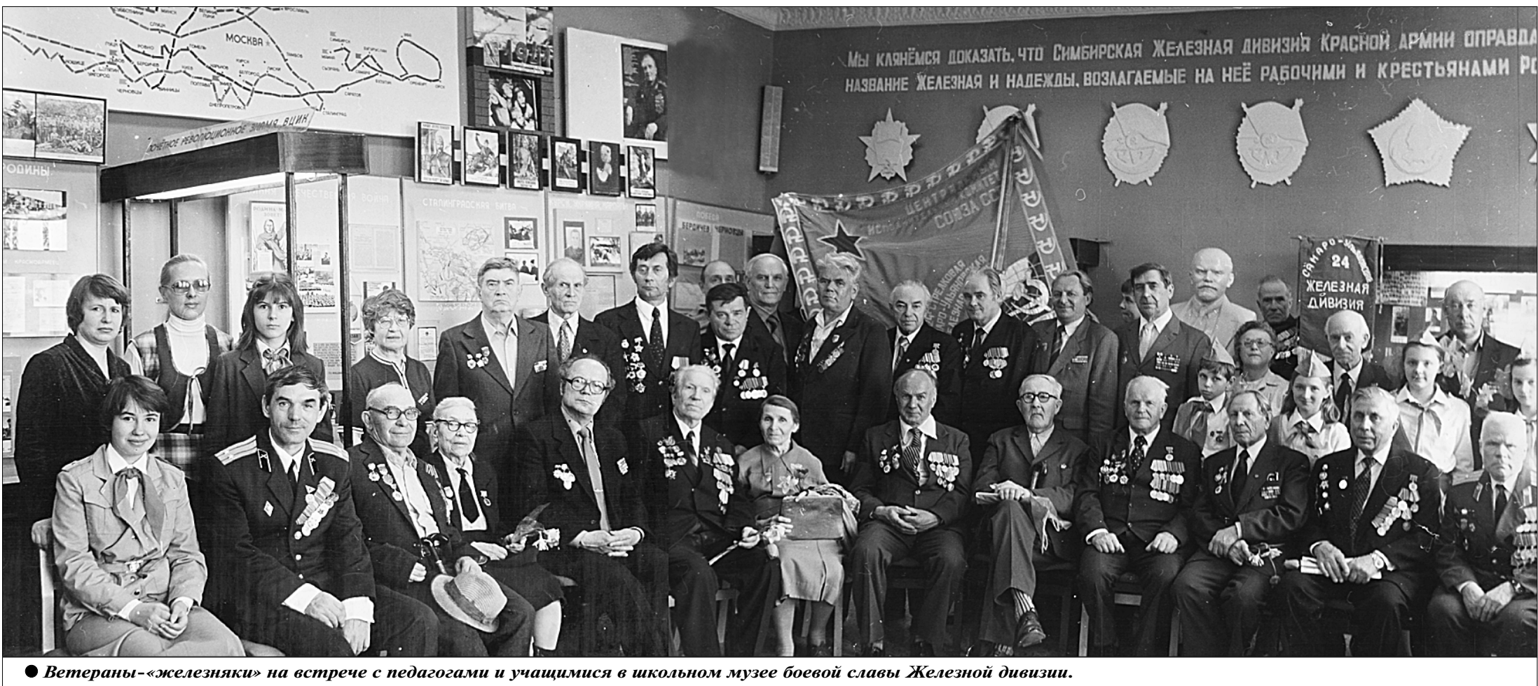
● Ветераны «железняки» на встрече с педагогами и учащимися в школьном музее боевой славы Железной дивизии.