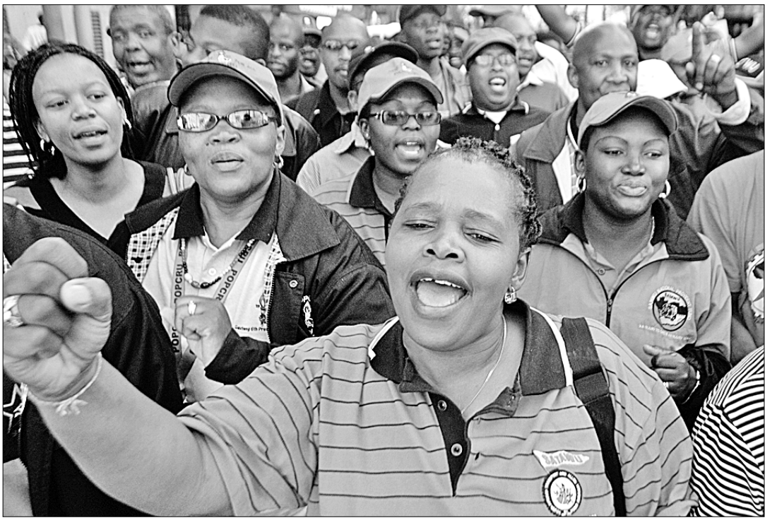
● В столице ЮАР Йоханнесбурге прошел марш протеста против роста цен.