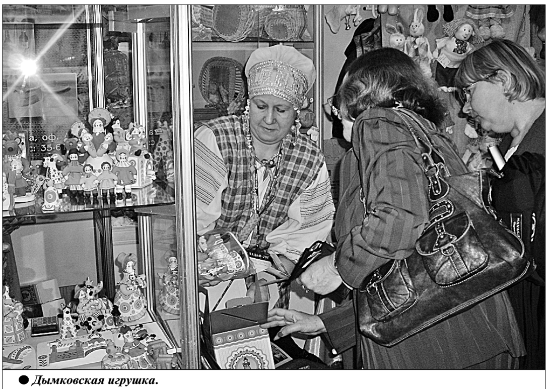
● Дымковская игрушка.