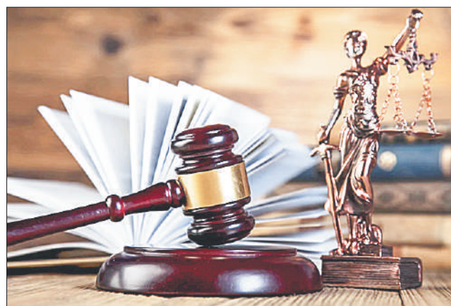
Стр. 3 – Болевые точки законодательства