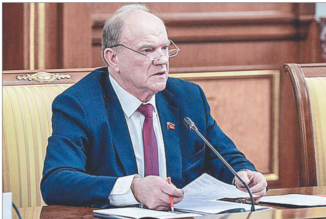
17 марта в рамках подготовки к отчёту правительства в Государственной Думе премьер-министр России Михаил Мишустин провёл встречу с представителями фракции КПРФ.

В беседе с коммунистами премьер-министр отметил, что КПРФ вносит вклад «в поиск более приемлемых и рациональных решений для развития страны и в социальной сфере, и в экономике, в сфере обороны, безопасности и промышленности».