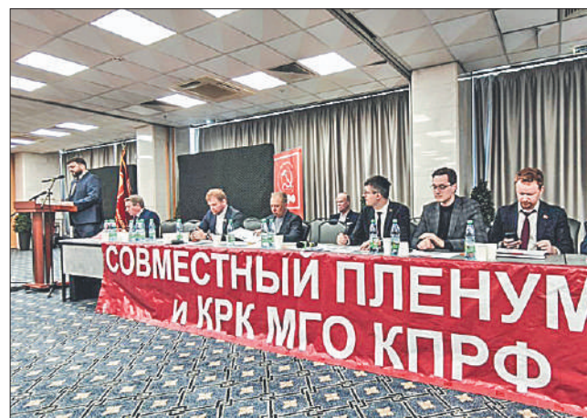
Стр. 2 – Главные задачи партии