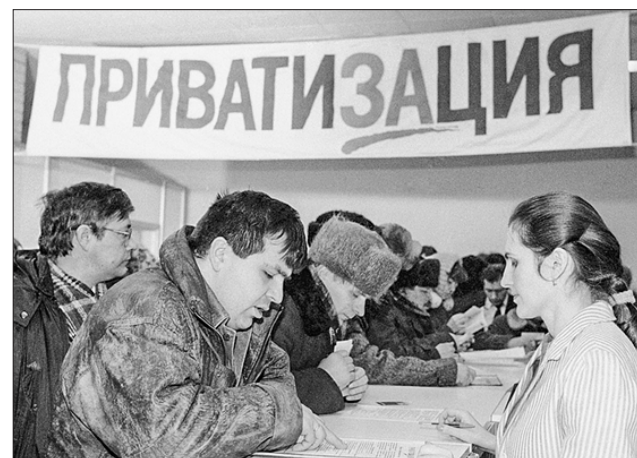
Стр. 4 – Повернуть вспять