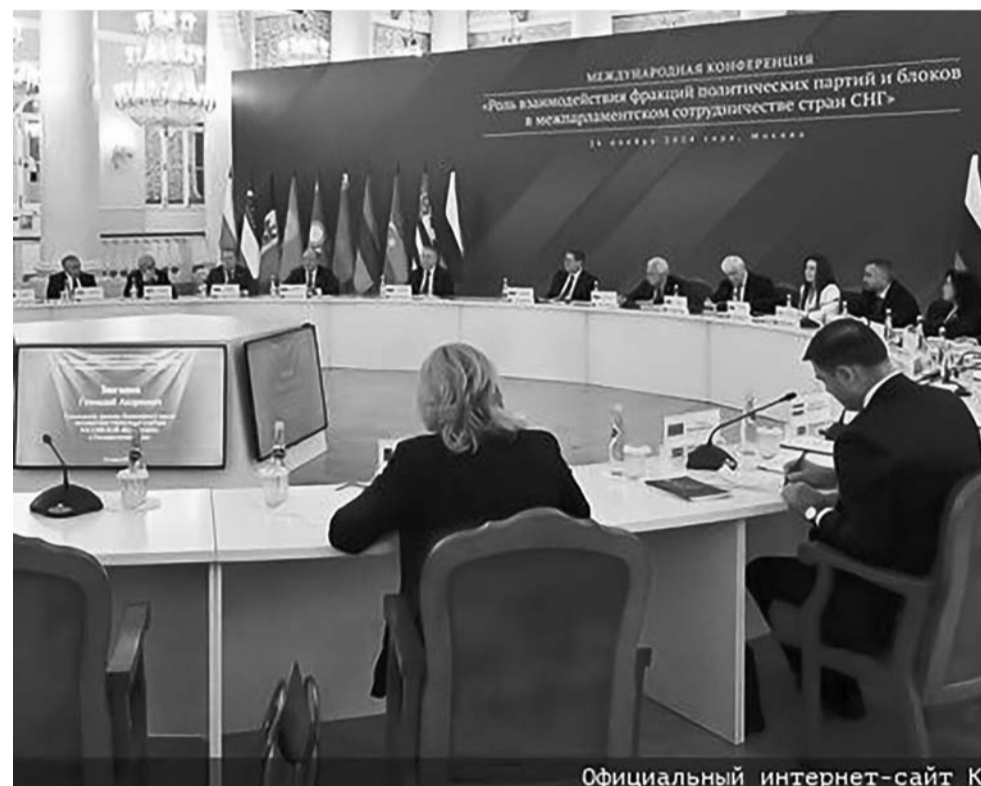
Официальный интернет-сайт К

Была создана великая промышленность, которая позволила нам победить гитлеровскую машину, имевшую четырехкратный перевес и подчинившую себе всё железо, все порты, все институты, все ресурсы не только Европы.