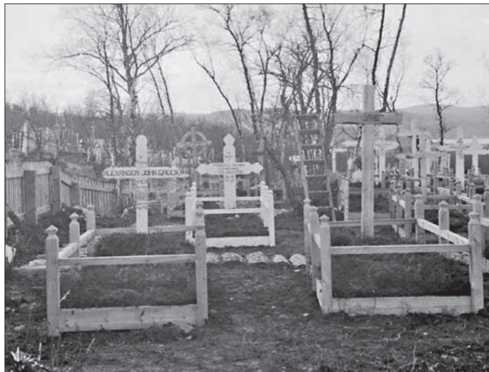
Участок британских военнослужащих и гражданских лиц на Мурманском городском кладбище «на Горе». За оградой участка видны захоронения жителей города. 1919 г.

Требуется продуманная концепция развития этой территории, которая позволит выявить и защитить по мере возможности остающийся в земле культурный слой. И что особенно важно – сохранить... привязанные к «Горе» исторические смыслы о нашем Отечестве для будущих поколений людей».