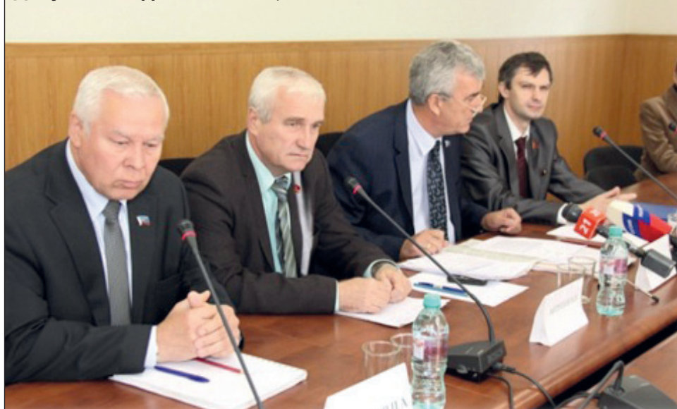
Депутатская фракция КПРФ, 2015 г.

безоговорочно поддерживают все инициативы губернатора. В то время как депутаты от КПРФ, а их в настоящее время всего трое, не могут влиять на принятие решений. Складывается впечатление, что исполнительная власть руководит законодательной. Не потому ли в народе постоянно звучат вопросы: зачем нужны лишние чиновники, получающие большую заработную плату?