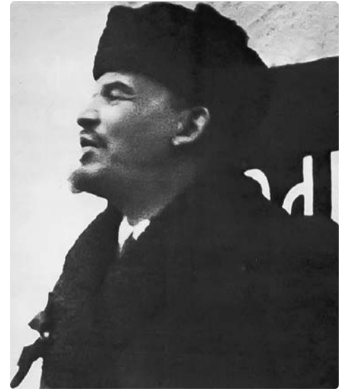
На фото: Москва, 7 ноября 1918 г. В. И. Ленин произносит речь на открытии памятника К. Марксу и Ф. Энгельсу на площади Революции.

Невозможно тут перечислить другие акты и несчетные встречи Ильича в дни славной первой годовщины Октября. Но об одной встрече нельзя не сказать. О ней в новогодье, через несколько недель, рассказал сам Владимир Ильич, написав развернутую статью: