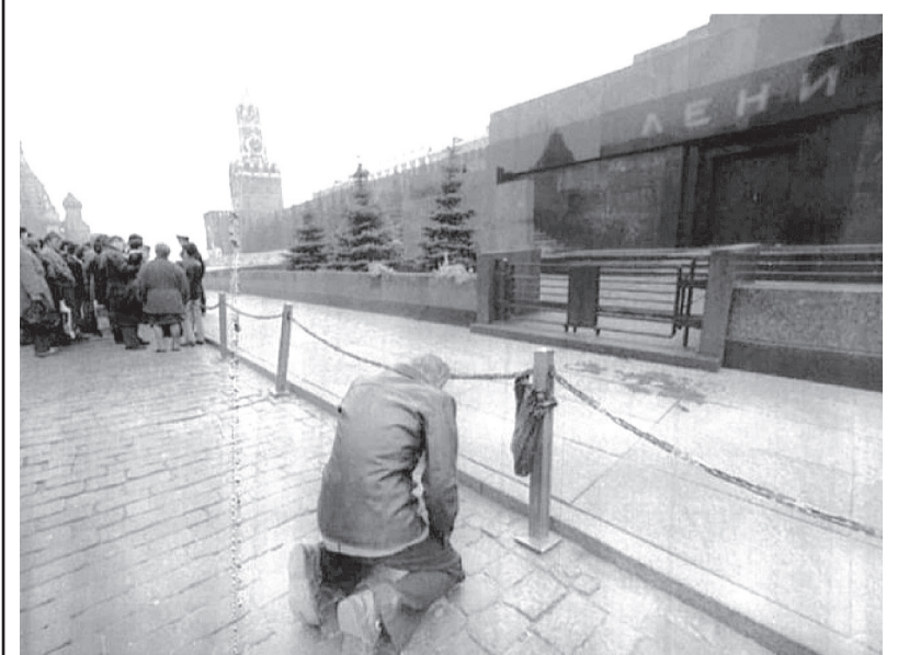
У Мавзоля В.И. Ленина 9 октября 1993 года