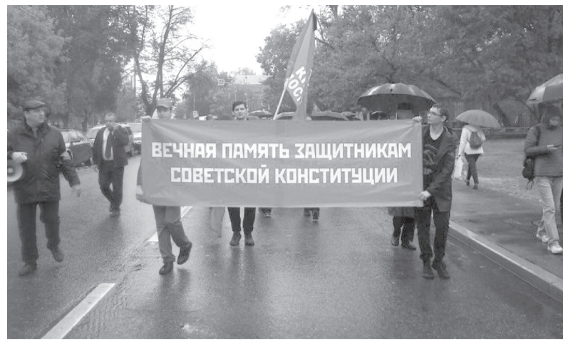
В 31-ю годовщину трагических событий «чёрного октября» в Москве прошли митинг у памятника Героям революции 1905 года, встреча депутатов с населением, шествие и возложение цветов к мемориалу «Поклонный крест».