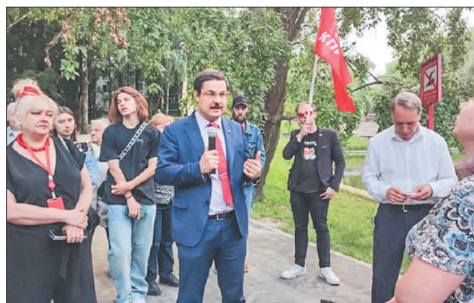
Стр. 5 – Управский беспредел у Деревлёвского пруда