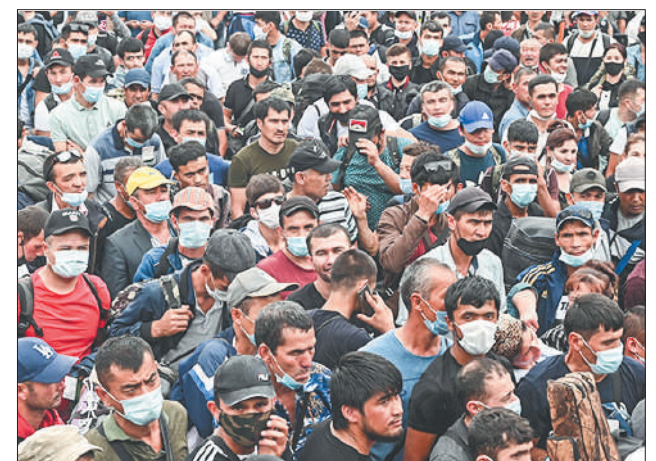
Стр. 7 – Правила гостевого этикета