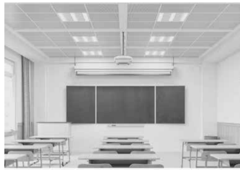
В России с 1 января 2025 года могут отменить ЕГЭ