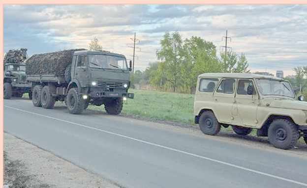
Колонна военных автомобилей движется на специальную военную операцию. «УАЗ» вологодских коммунистов – впереди.

Огромное спасибо всем, кто откликнулся на нашу просьбу и внес посильный денежный вклад в приобретение автомобиля!