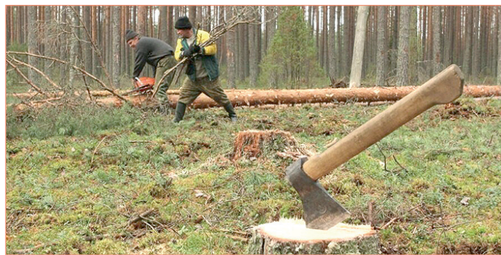
Перепродажа или вырубка леса - вот для чего в большинстве случаев брали «вологодский гектар» жители других регионов.

— Коммунисты с самого начала сомневались, что эта программа, широко разрекламированная экс-губернатором Олегом Кувшинниковым, будет реализована, — прокомментировал коллизию