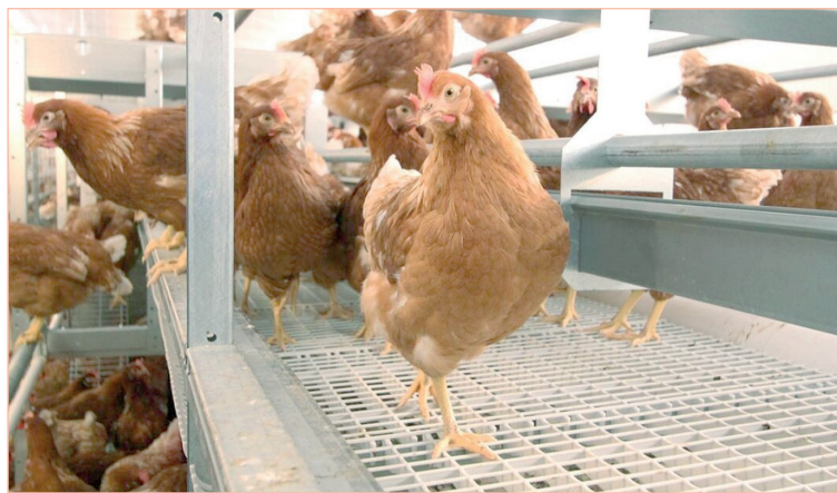
Никаких объективных предпосылок к скачку цен на яйцо не было. Бизнесмены просто использовали момент.

С другой стороны, в правительстве области признают, что признаки сговора имеются. Но повлиять на них нынешнее руководство региона почему-то не может. Речь идет только о том, чтобы «задавить рынок объемами», вынудив производителей снизить цены. Предлагают подождать запуска на полную мощность пострадавшей от птичьего гриппа фабрики «Малечкино», обещают принять меры по стимулированию производства на других предприятиях. Результат, как утверждают, будет к октябрю-ноябрю. Но это не точно.