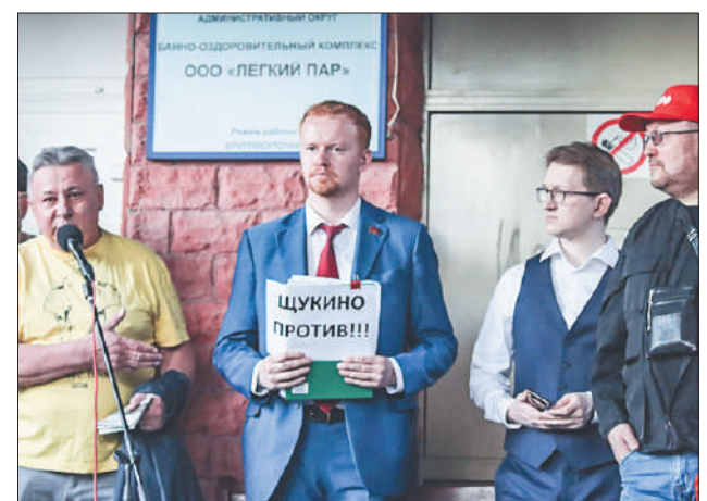
Стр. 8 – Снести нужное, построить ненужное