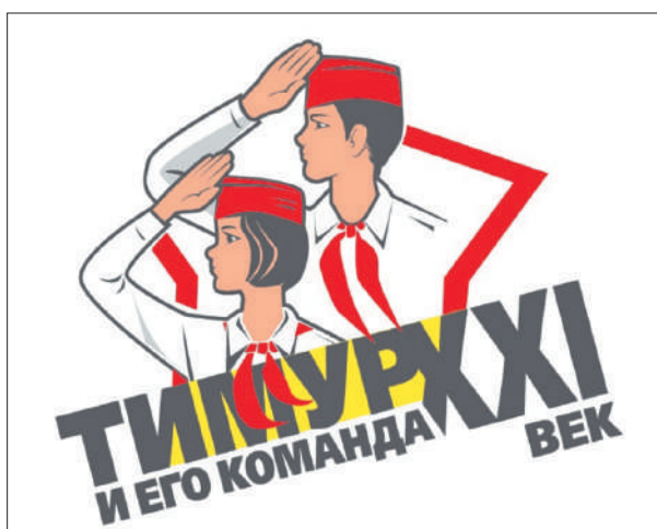
Стр. 6 – Тимур и его команда, XXI век