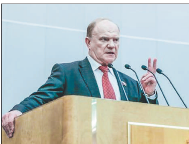
Стр. 2 – Бухгалтерия не должна определять политику!