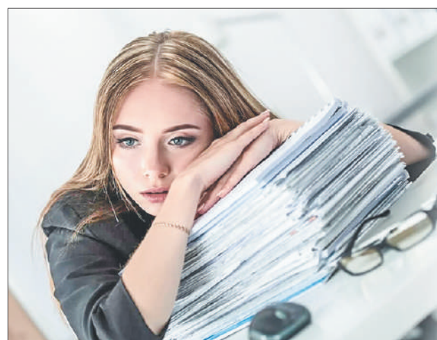
Стр. 8 – Бумажные солдаты