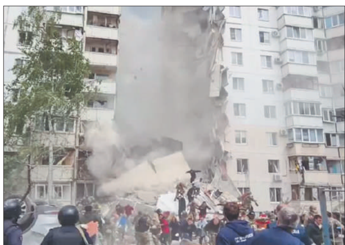
Стр. 2 – Белгород, мы с тобой!