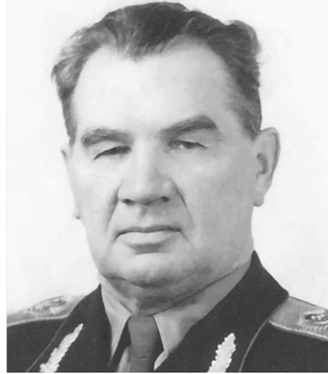
сталинградцами. Они все как один называют вас лжецом и предателем.

«От имени живых и погибших в бою сталинградцев, от имени их отцов и матерей, жён и детей я обвиняю вас, А. Солженицын, как бесчестного лжеца и клеветника на героев-сталинградцев, на нашу армию и наш народ. Я уверен, что это обвинение будет поддержано всеми