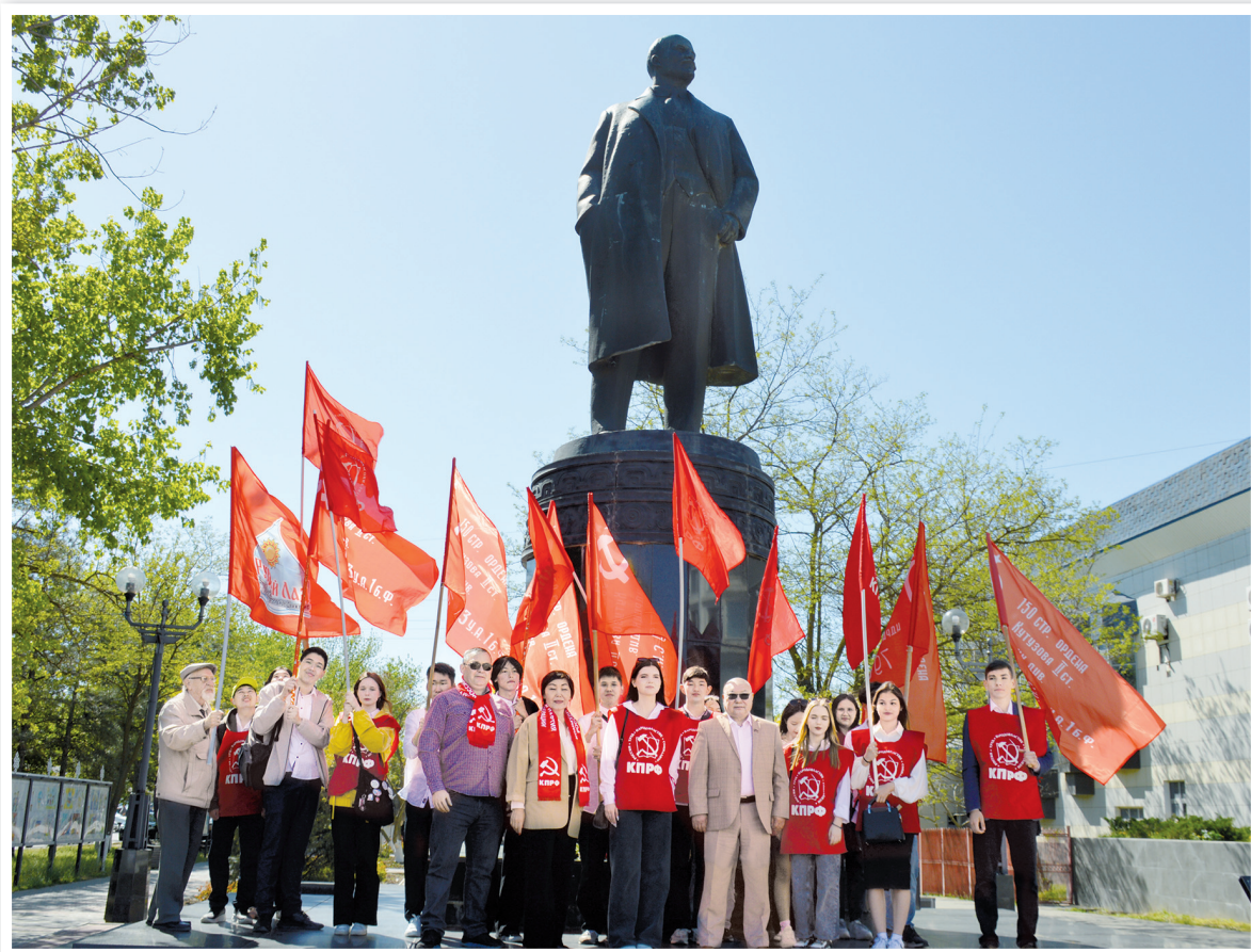
Участники торжественного мероприятия. Элиста, 22 апреля 2024 года

22 апреля, в 154-ю годовщину со дня рождения В.И.Ленина, коммунисты Калмыкии и их сторонники возложили цветы к памятникам вождю мирового пролетариата.