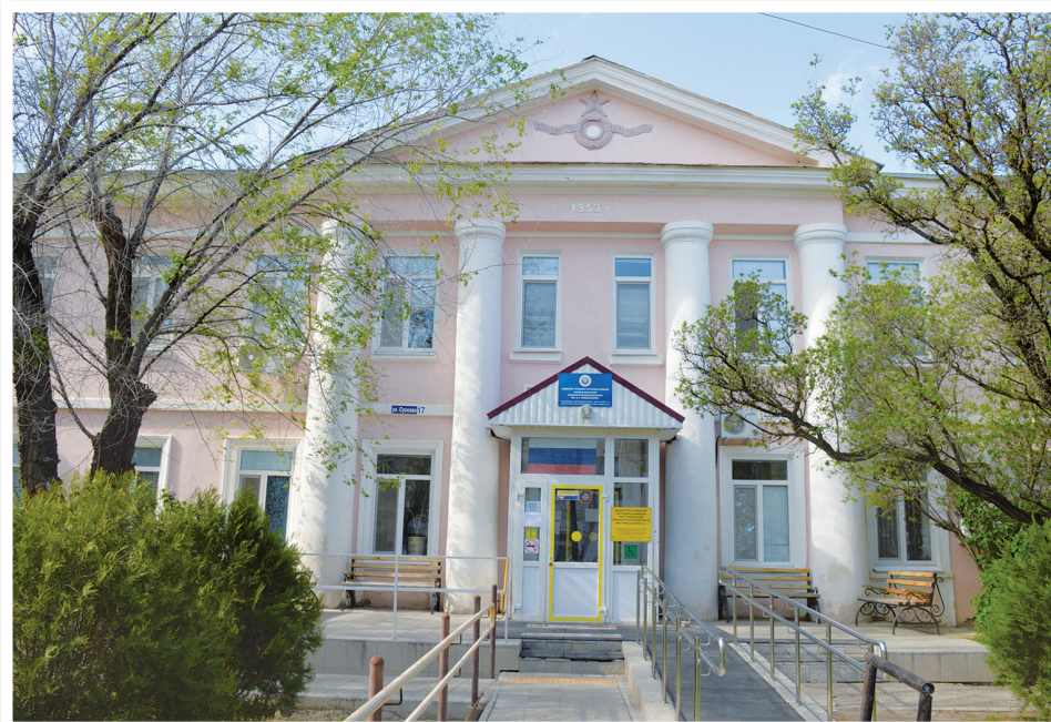
Здание Республиканского онкологического диспансера им. Э.С. Тимошкаевой

В рамках федерального проекта «Борьба с онкологическими заболеваниями» в Калмыкии поэтапно ведется переоснащение онкологической службы. Оборудования для диагностических исследований достаточно, за исключени-