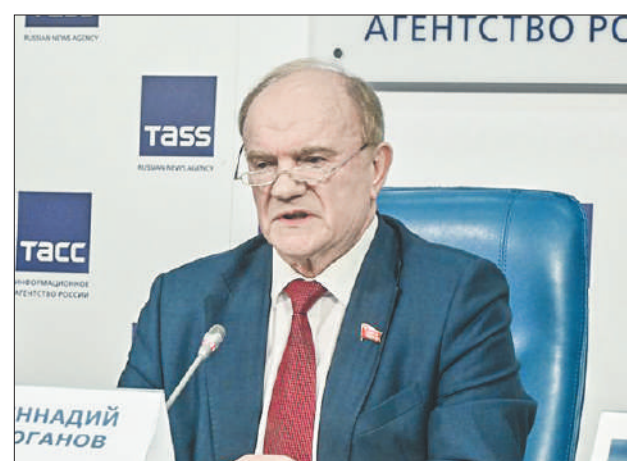
Стр. 8 – Учиться, учиться и ещё раз учиться!