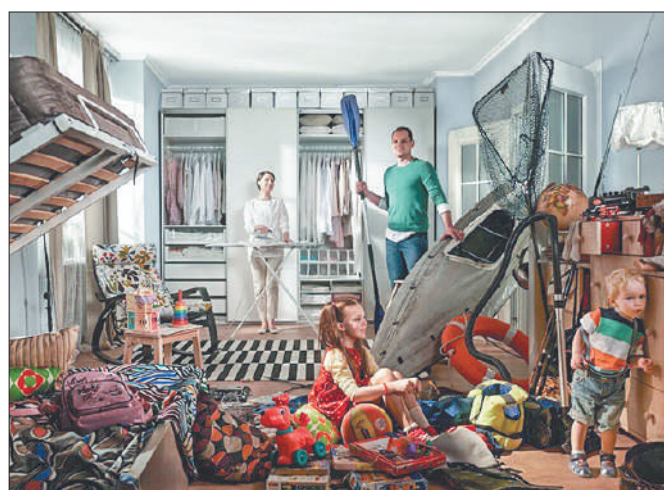
Стр. 4 – В тесноте да... сколько можно!