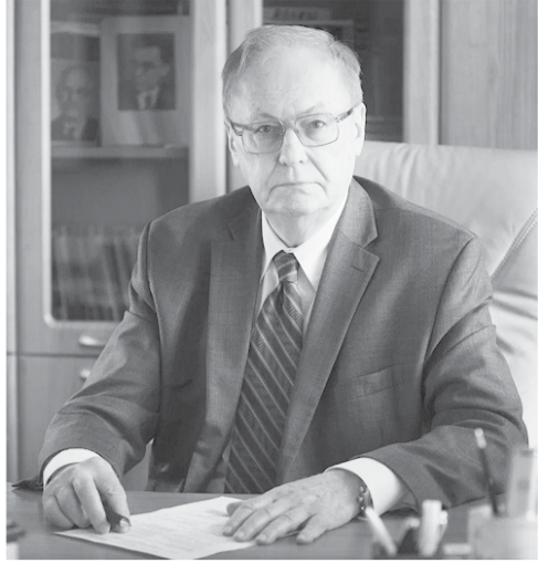
(Продолжение. Начало в № 47 (1509))

В области образования Россия пошла по пути США, где 95% детей получают облегчённое образование. Беда в том, что образованием и просвещением у нас руководят чиновники.