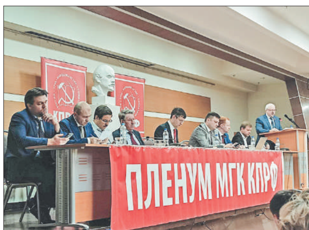
Стр. 3 – КПРФ — за сильную экономику и промышленность!