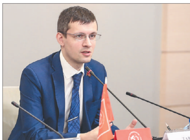
Стр. 2 – Как оказаться экстремистом