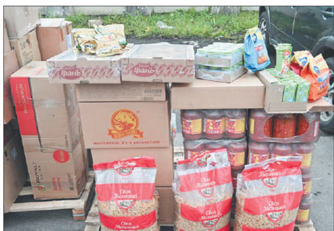
Стр. 3 – 118-й гуманитарный конвой ушёл на Донбасс