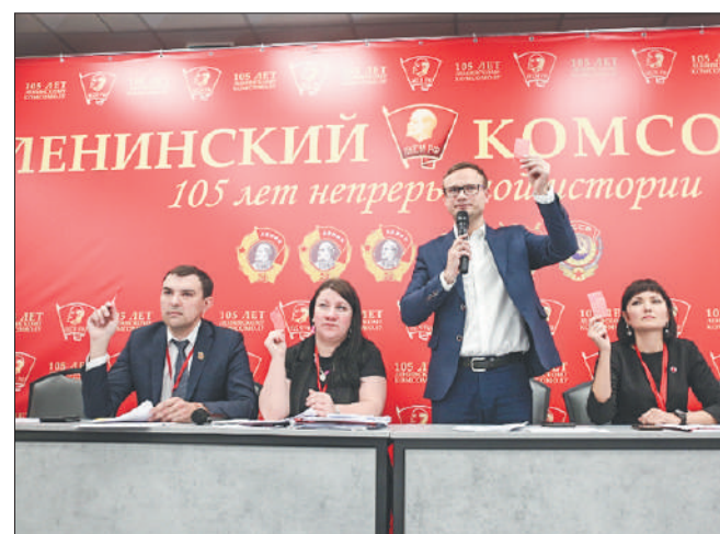
Стр. 5 – Комсомолу — 105 лет!