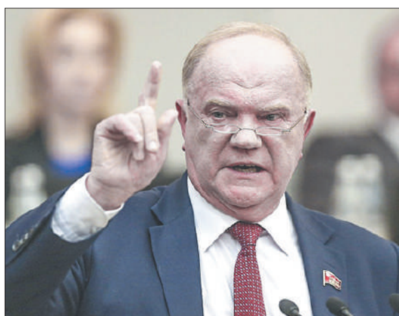
Стр. 4 – За такой бюджет голосовать не будем!