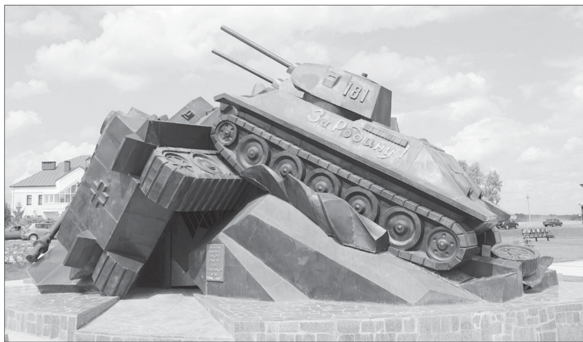
Памятник «Танковый таран. Прохоровка»

Накануне сражения советская разведка установила, что наступление противника на орловском направлении назначено на 03.00