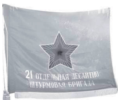
Боевое Знамя 21-й ОДШБр. Аверс

Первые десантно-штурмовые операции (действия), связанные с высадкой сравнительно неболь-