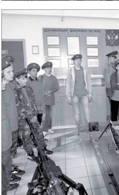
Воспитанники «Прометей» знакомятся с образцами стрелкового оружия Воздушно-десантных войск. 247-й гв. ДШП. 2016 год

Возникает вопрос: В чём же тайна успехов русских воинов и русского оружия, которую мы должны постичь и вновь сделать нормой нашей жизни? Тайна в братском единении, войсковом товариществе, дисциплине и любви к Родине.