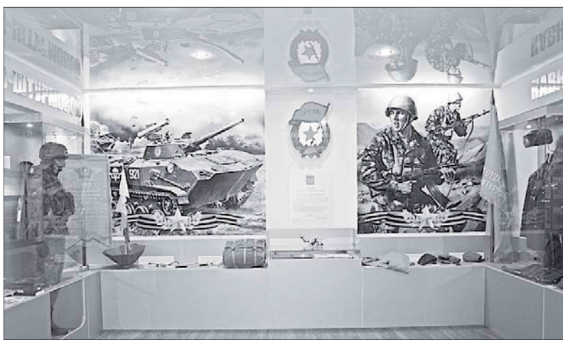
Первый зал музея «Боевой Славы»