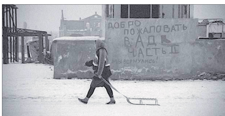
Грозный. Зима, 1999 год

Через несколько месяцев 7 апреля 1989 года в директиве начальника Генштаба Моисеева говорилось: «... Командующему войсками КЗакВО привести в полную