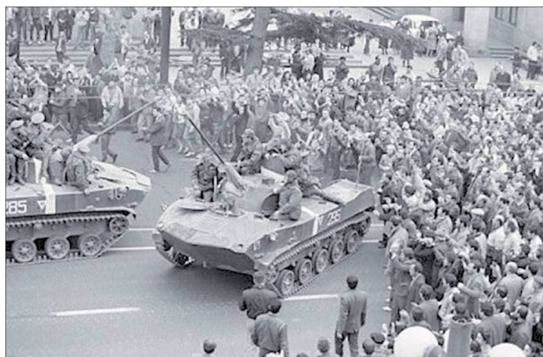
Один из эпизодов апрельских событий 1989 года с участием советских войск в Тбилиси

врага каждую пядь родной земли, не щадя своей крови и самой жизни.