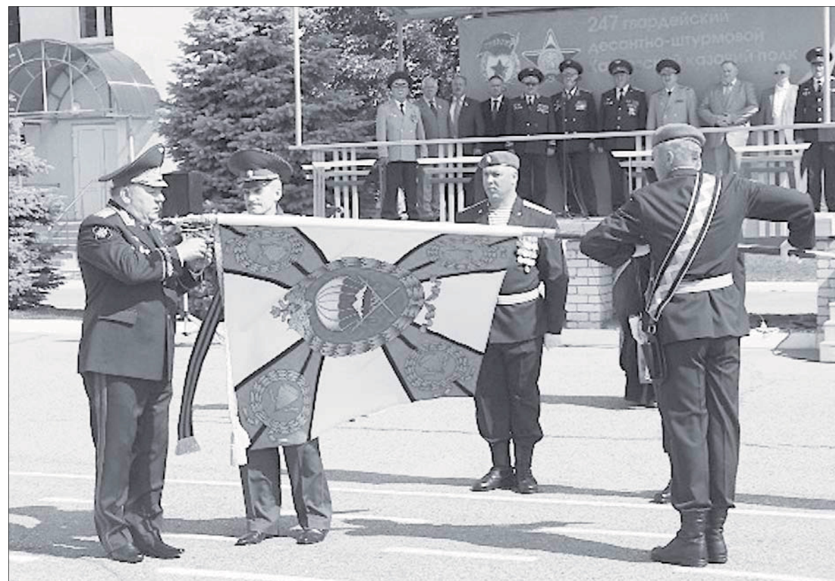
Командующий ВДВ Герой России генерал-полковник В.А. Шаманов выполняет поручение Президента РФ по награждению Гвардейским Знаменем 247-го ДШП

эшелонах (5 воинских эшелонов) в Республику Абхазия.