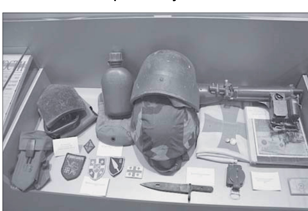
Элементы экипировки военнослужащих Грузии