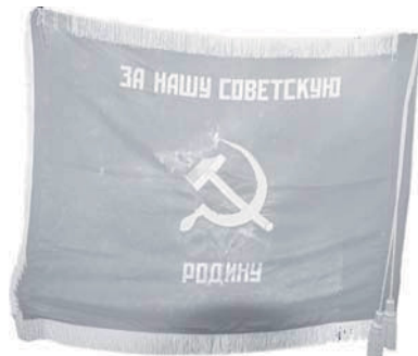
Боевое Знамя 21-й ОДШБр. Реверс

ших десантов, были проведены немцами в ходе Второй мировой войны. Способы десантирования при этом были самые разные: парашютный, посадочный на планерах, посадочный на самолётах. Но в последующие годы войны такие десанты фактически не использовались. Выходящие стороны заинтересовались более крупномасштабными воздушно-десантными операциями, которые способны уже сами по себе повлиять на общую оперативно-стратегическую обстановку на фронте. В этом же русле продолжалось и послевоенное развитие, в том числе и в советской теории применения ВДВ.