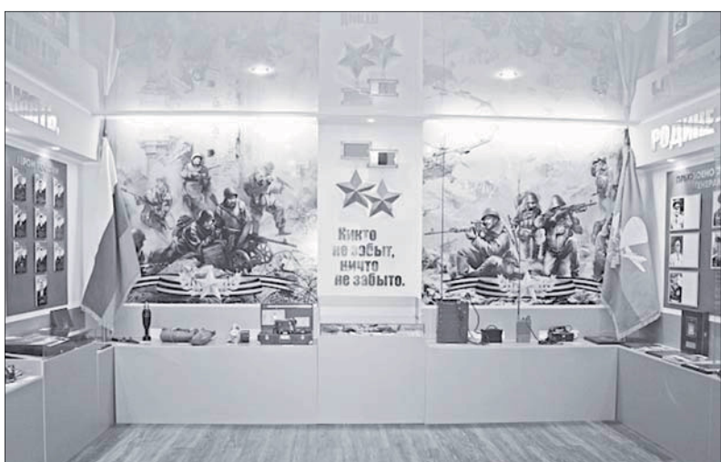
Второй зал музея «Боевой Славы»