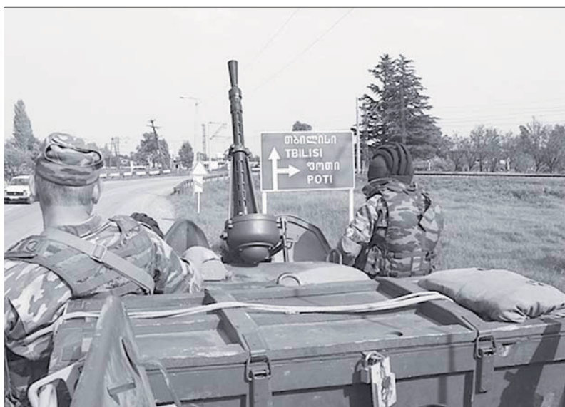
«У неприятеля те же руки, да русского штыка не знают», - Генералиссимус А.В. Суворов. По дорогам Грузии

В качестве одних из представителей воздушно-десантных войск России были и десантники 247-го гвардейского ДШП. Личным составом разведывательной роты