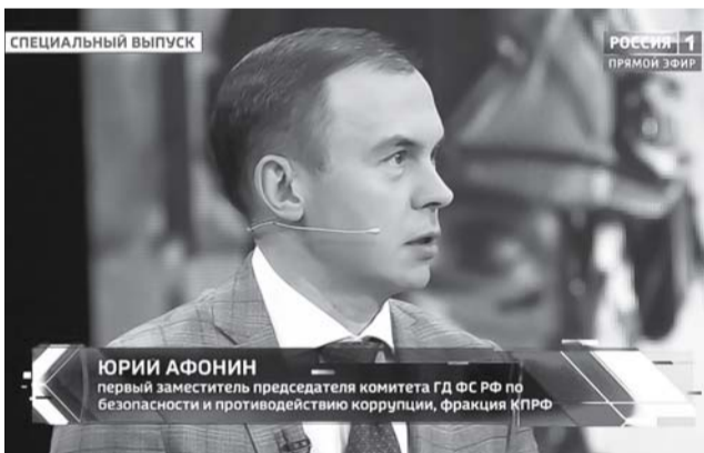
ЮРИЙ АФОНИН первый заместитель председателя комитета ГД ФС РФ по безопасности и противодействию коррупции, фракция КПРФ

В студии обсуждалось очередное скандальное заявление Белого дома. На фоне встречи в верхах лидеров стран «большой семерки» в японском городе Хиросима советник Байдена по нацбезопасности Салливан заявил, что тот не будет извиняться за сброшенную на город в 1945 году американскую атомную бомбу. Одновременно стало известно, что Совет Европы утвердил создание реестра ущерба, причиненного Украине во время боевых действий, – с целью взыскания востребованных компенсаций с России.