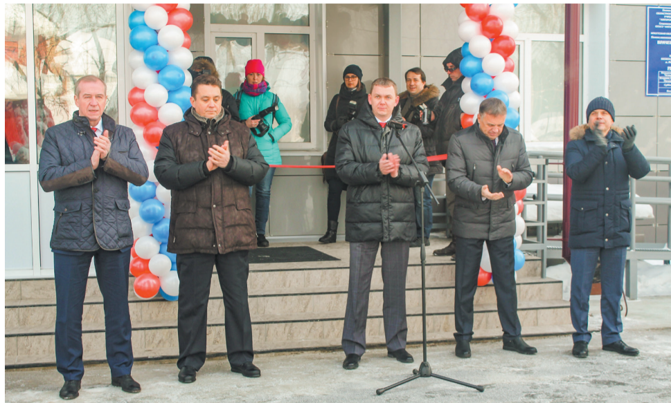
Посёлок Мегет Ангарского городского округа, открытие поликлиники, 19 февраля 2018 года, фотограф: Яна Ушакова

Что мы ещё сделали? Совместно с министерством социального развития, опеки и попечительства Иркутской области и уполномоченным по правам человека мы разработали проект закона о внесении изменений в законодательство об усыновлении. Мы внесли дополнения, облегчающие оформление опекуна в плане бюрократии и документооборота.