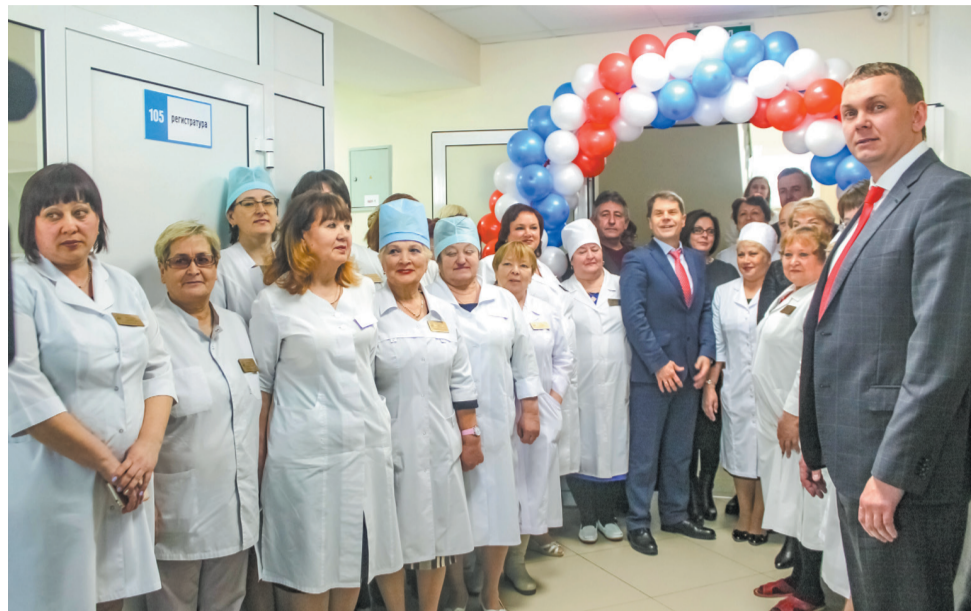
На встрече с коллективом Ангарской больницы № 1

Это и доступно, и с точки зрения экономики тоже очень выгодно. Потому что, если сегодня посчитать затраты на выезд бригады скорой помощи, то это большие деньги. Мы сможем исключить «холостые» выезды.