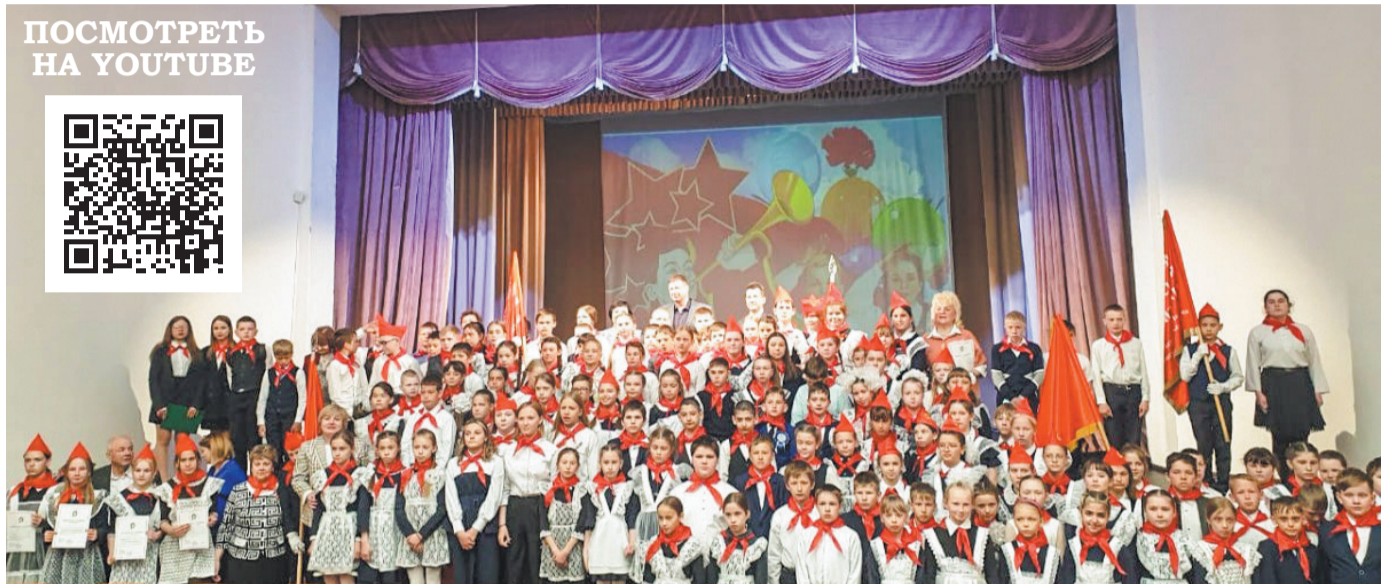
В Усольском районе в День пионерии повязали красные галстуки 128 школьникам